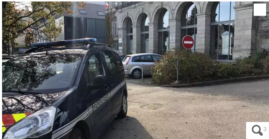
Les deux prévenus ont été jugés dans le cadre d'une comparution immédiate à Vannes (Morbihan).

Poubelles, maisons, immeubles... Durant trois soirs, ces deux jeunes de 19 ans, sans repère, ont semé la terreur à La Gacilly (Morbihan), en cette mi-septembre 2022, en allumant plusieurs feux. Ils ont écopé de cinq ans de prison dont trois avec sursis probatoire.