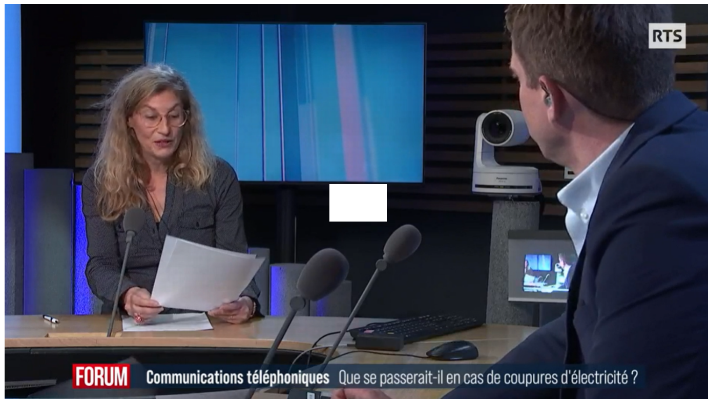
Communications téléphoniques: que se passerait-il en cas de coupure d'électricité? / Forum / 2 min. / le 10 novembre 2022

Après avoir pris conscience de leur fragilité en cas de panne électrique, les grandes entreprises réalisent toutes des tests. C'est notamment le cas des opérateurs de téléphonie. Les risques de friture sur la ligne sont multiples.