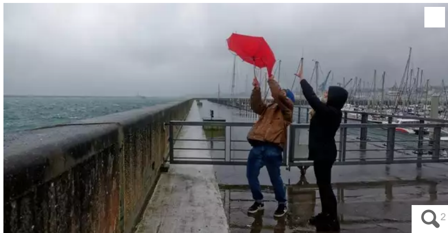
Une tempête à Brest, le 8 février 2019. Image d'illustration

Votre e-mail, avec votre consentement, est utilisé par la société Ouest-France Multimédia pour recevoir les newsletters sélectionnées. En savoir plus