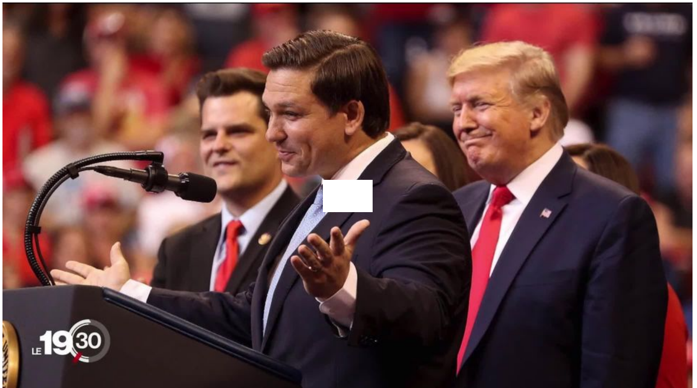
Le gouverneur de Floride, Ron DeSantis, star montante des Républicains, pourrait briguer la présidence en 2024. / 19h30 / 3 min. / le 24 octobre 2022

>> Revoir le portrait de Ron DeSantis dans le 19h30, avant le scrutin: