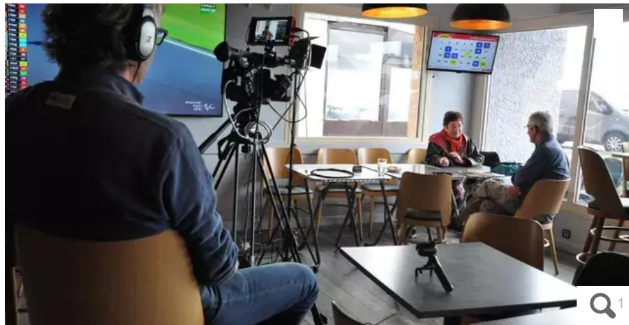
Les témoignages de cinq habitants du Fort-Bloqué ont été enregistrés samedi matin au bar Les Tamaris.

L'Association pour l'environnement et la promotion de Fort-Bloqué et des villages environnants (AEP) est attachée à la préservation de l'environnement et la qualité de vie à Fort-Bloqué, à Plœmeur (Morbihan). Pour créer du lien entre les habitants et conserver leur histoire, un projet de collecte de témoignages a débuté samedi matin 5 novembre 2022.