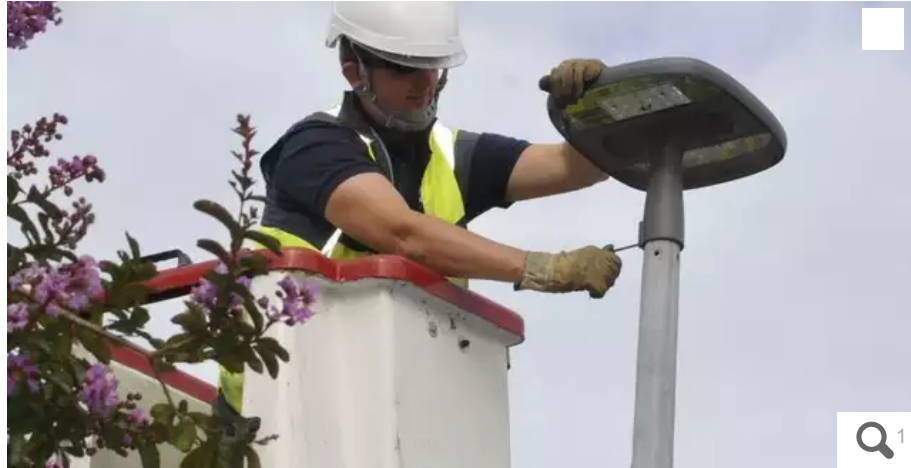
La Ville de Lorient (Morbihan) ne se contente pas de couper l'éclairage public entre minuit et 6 h. Elle « relampe » son système d'éclairage, en remplaçant ses lampes par des Led (diodes électroluminescentes), moins énergivores. Ici, la photo d'un agent intervenant sur un changement de luminaire.

Votre e-mail, avec votre consentement, est utilisé par la société Ouest-France Multimédia pour recevoir les newsletters sélectionnées. En savoir plus