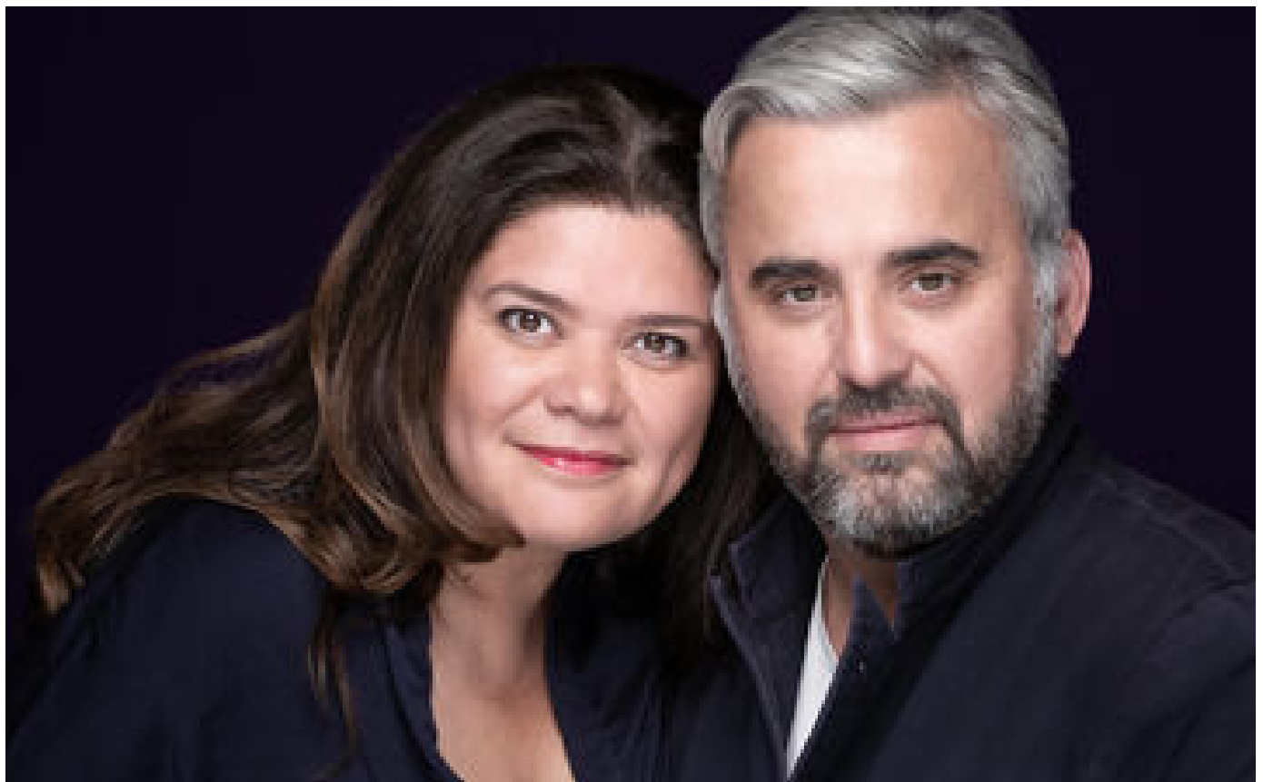
Abonnés Affaire Garrido-Corbière : derrière la fausse employée maltraitée, les coulisses d'un incroyable complot politique