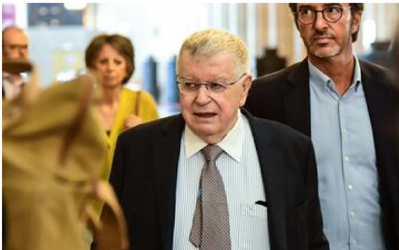
Harcèlement moral à France Télécom : l'ex-PDG Didier Lombard et son numéro deux se pourvoient en cassation