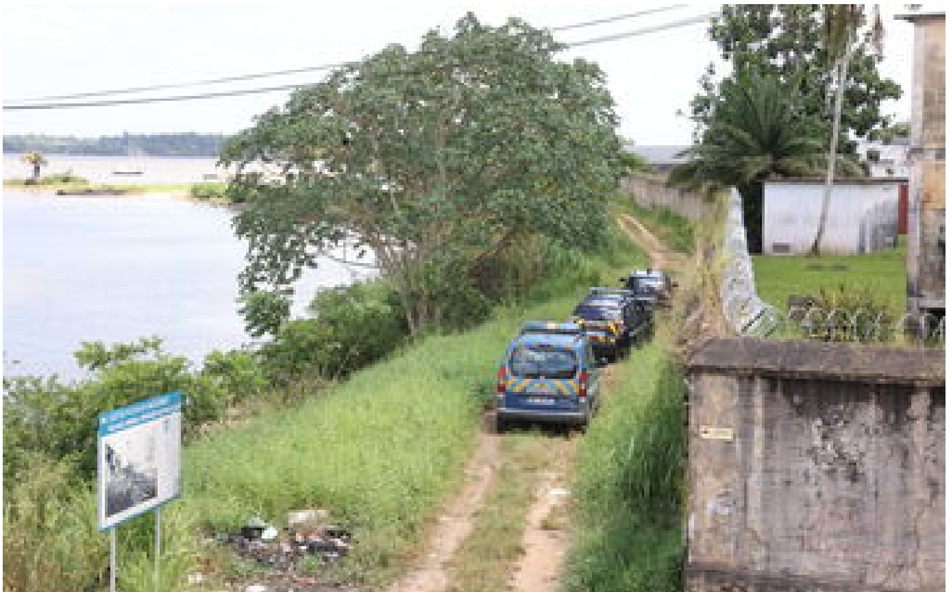
Guyane : deux adolescentes blessées par balles près d'un lycée