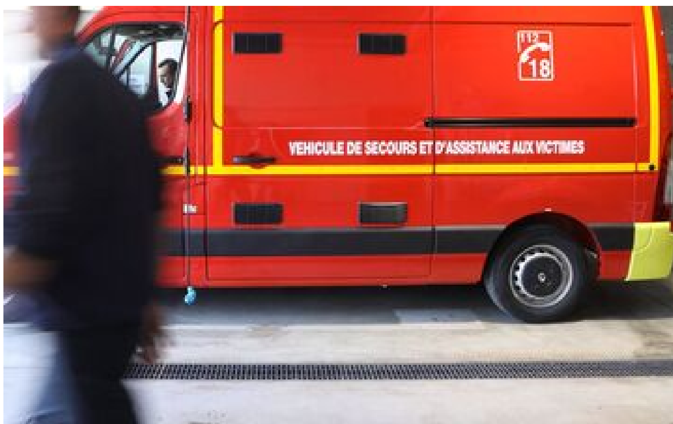
Femme tuée à Nantes : un homme de 21 ans mis en examen pour homicide volontaire en état d'ivresse