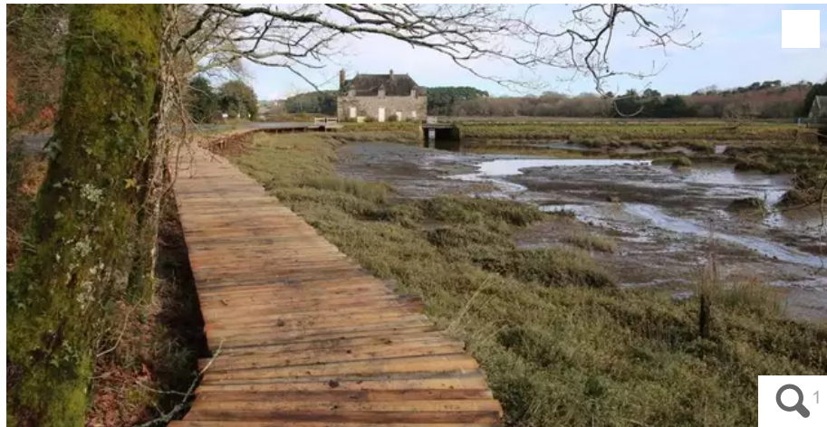
La cour administrative d'appel de Nantes doit statuer sur le droit de passage le long de l'étang de Kervilio au Bono.

Au Bono (Morbihan), les propriétaires du moulin à marée de Kervilio contestent l'ouverture des berges au cheminement des promeneurs. La cour administrative de Nantes devra statuer sur la servitude de passage, le 28 octobre 2022.