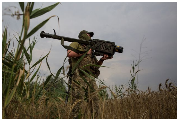
Un soldat ukrainien portant un lance-missile Stinger, dans la région de Mikolaïv, en août 2022. La production de cette arme a cessé en 2020.

Aujourd'hui, le gouvernement américain doit convaincre l'industrie de rouvrir des chaînes de montage et de relancer des productions qui avaient été abandonnées, comme celle des missiles antiaériens Stinger, dont la production a cessé en 2020.