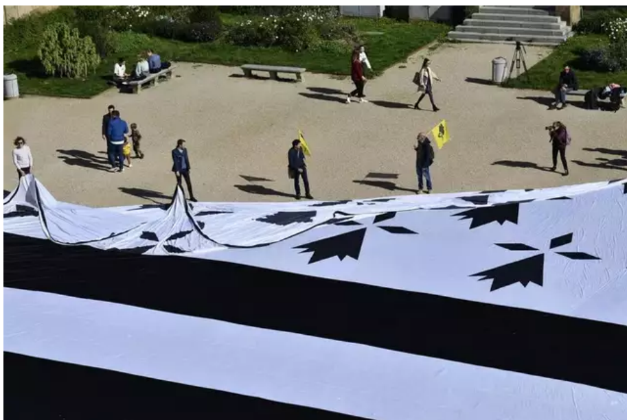
Rennes, place du Parlement. Déploiement du plus grand drapeau Berton du monde (1 400 m 2 ) (« gwenn ha du » en breton). Une action pour demander le rattachement de la Loire-Atlantique à la Bretagne.