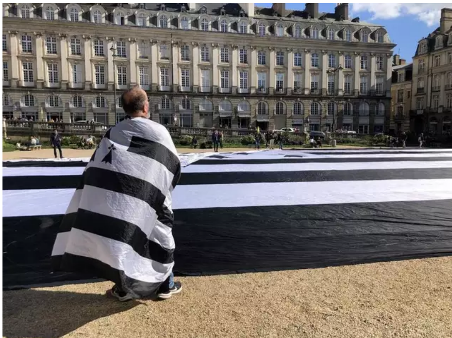
Des militants ont déployé un drapeau breton géant à Rennes pour demander la réunification de la Loire-Atlantique à la Bretagne.