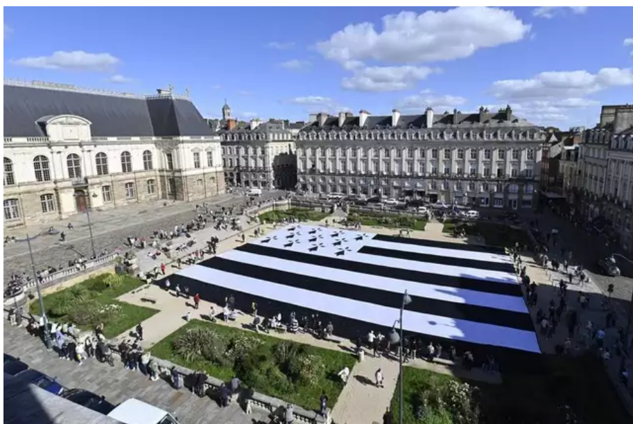
Rennes, place du Parlement. Déploiement du plus grand drapeau Berton du monde (1 400 m 2 ) (« gwenn ha du » en breton). Une action pour demander le rattachement de la Loire-Atlantique à la Bretagne.

Après le vote d'un vœu par les élus ligériens, puis par le conseil régional de Bretagne, demandant l'organisation par l'État d'un référendum en Loire-Atlantique sur la question de la réunification, la Région a récemment validé la commande d'une étude d'impact d'un redécoupage à cinq départements.