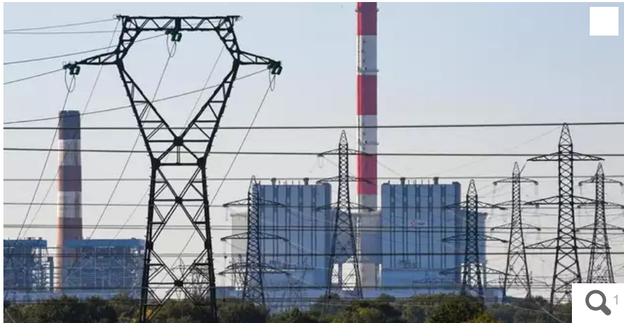
La centrale de Cordemais voit son projet Ecocombust validé et sa consommation électrique augmenter cet hiver.

La préfecture a pris un arrêté pour autoriser la centrale de Cordemais, en Loire-Atlantique à brûler davantage de charbon cet hiver et valide le projet de biomasse, Ecocombust.