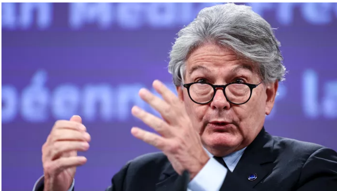
Thierry Breton, commissaire européen au Marché intérieur.

Les États membres «réagissent et c'est bien, mais il faut le faire de manière coordonnée, car le marché intérieur fonctionne, car nous avons des règles à peu près similaires partout», a-t-il insisté.