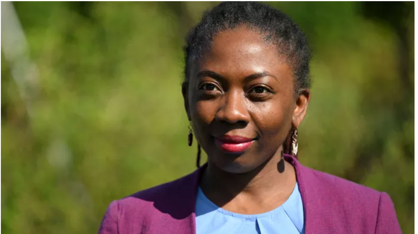
Danièle Obono, députée LFI de Paris

La députée LFI a vulgairement dénoncé les railleries subies par Sandrine Rousseau et Manon Aubry, huées dimanche au rassemblement pour les Iraniennes.