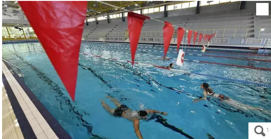
À Nantes, les piscines de la ville sont fermées au public le matin. Les créneaux sont réservés aux écoles et associations.

Repéré sur Twitter, la grogne d'un Nantais qui voulait nager ce vendredi matin 30 septembre. Fermées au public, les piscines nantaises réservent leurs créneaux aux écoles et associations à cette période de la journée.