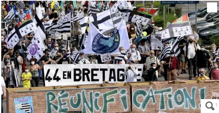
Une manifestation pour promouvoir une Bretagne à cinq départements s'était déroulée en juin 2021 à Redon.

Le sujet de la réunification de la Bretagne continue à faire son chemin. Le 26 septembre 2022, les conseillers régionaux ont voté le lancement d'une étude d'impact. Elle devra éclairer les élus sur les conséquences d'une réunification. La Région Bretagne compte demander à l'État, en 2023, une « consultation » à ce sujet.