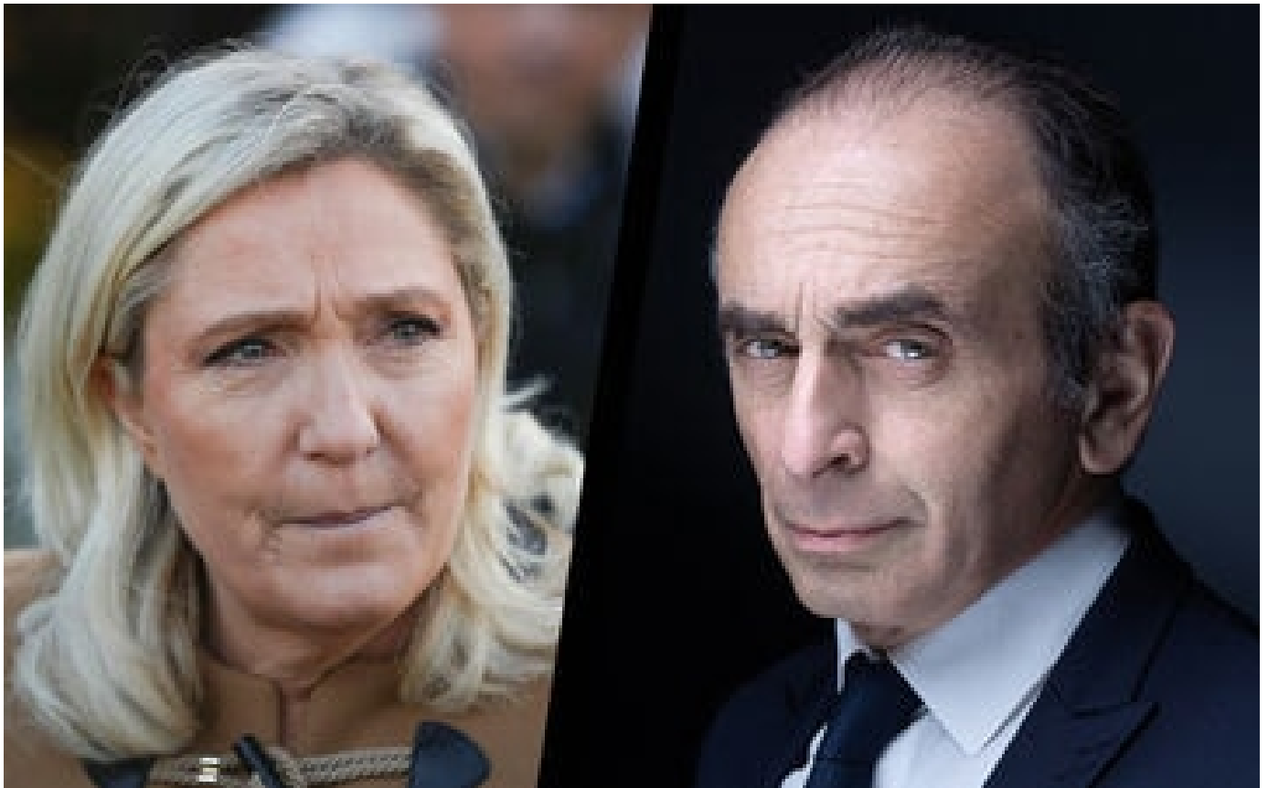
Législatives en Italie : Marine Le Pen, Éric Zemmour et une partie de LR saluent la victoire de Georgia Meloni