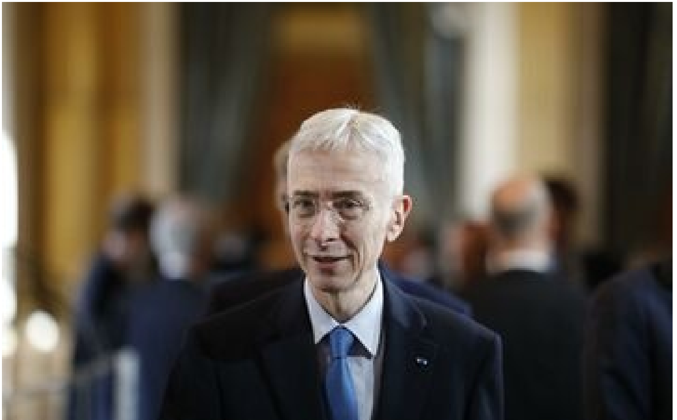
L'ancien préfet de police Didier Lallement nommé secrétaire général de la mer