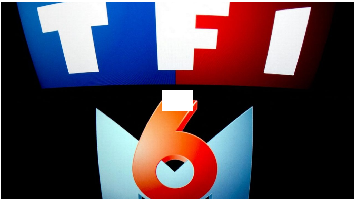
TF1 et M6 ont annoncé l'abandon de leur projet de fusion / Le Journal horaire / 14 sec. / hier à 20:02

Le mariage n'aura finalement pas lieu: TF1 et M6 ont annoncé vendredi l'abandon de leur projet de fusion, jugeant qu'il ne présentait "plus aucune logique industrielle", un coup de théâtre après des mois d'incertitude.