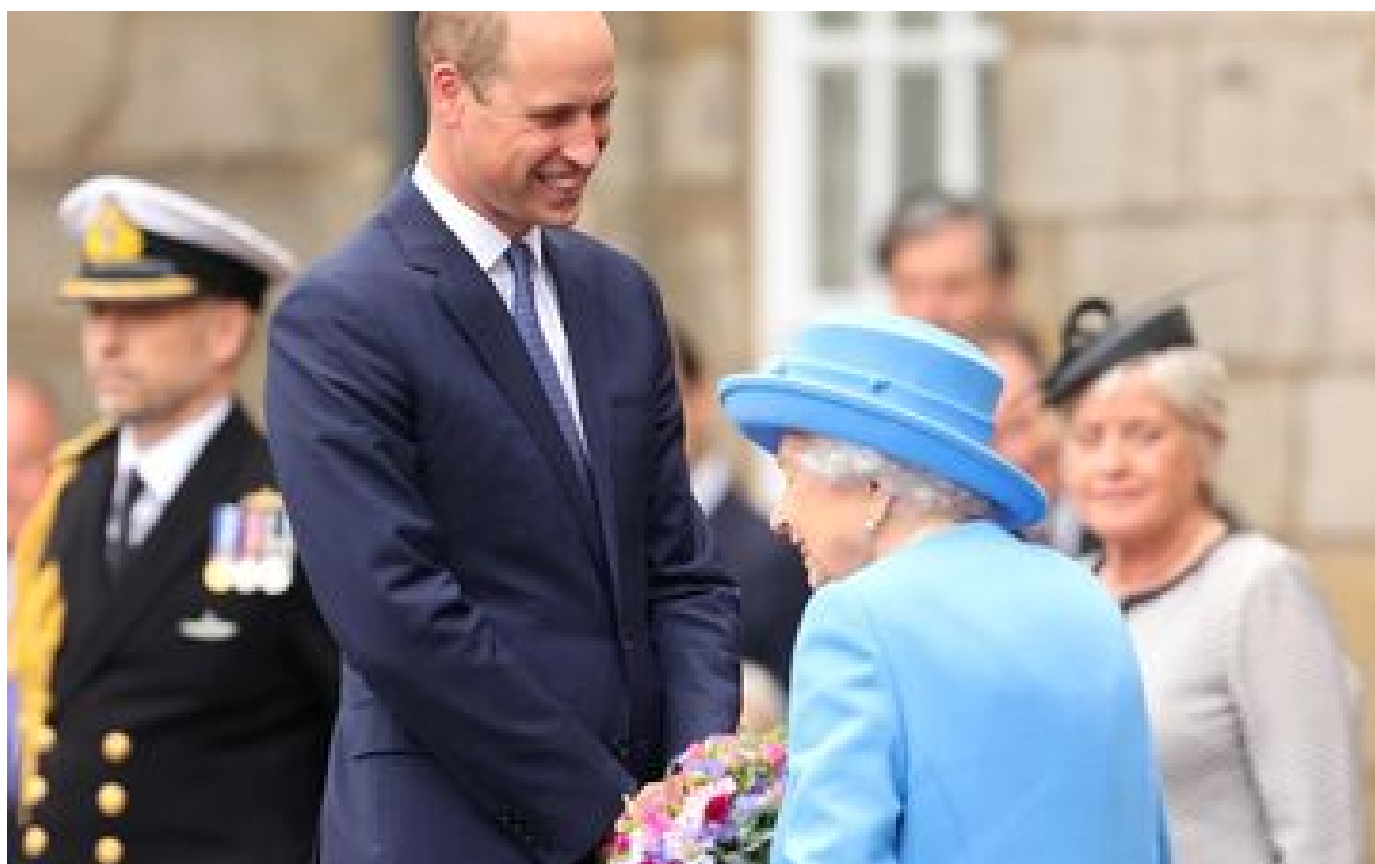
Abonnés Mort d'Elizabeth II : avec William, duc de Cambridge, la relève est assurée