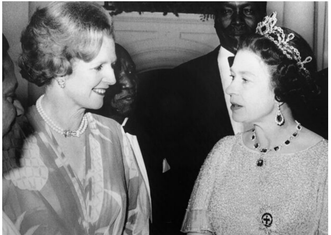
British Prime minister Margaret Thatcher (L) and Queen Elizabeth II attend the Commonwealth conference on August 01, 1979 in Lusaka.

9. Margaret Thatcher a été Première ministre pendant plus de 11 ans. Les deux femmes se sont donc rencontrées à de nombreuses reprises, comme ici, lors d'une conférence du Commonwealth, en 1979 en Zambie.