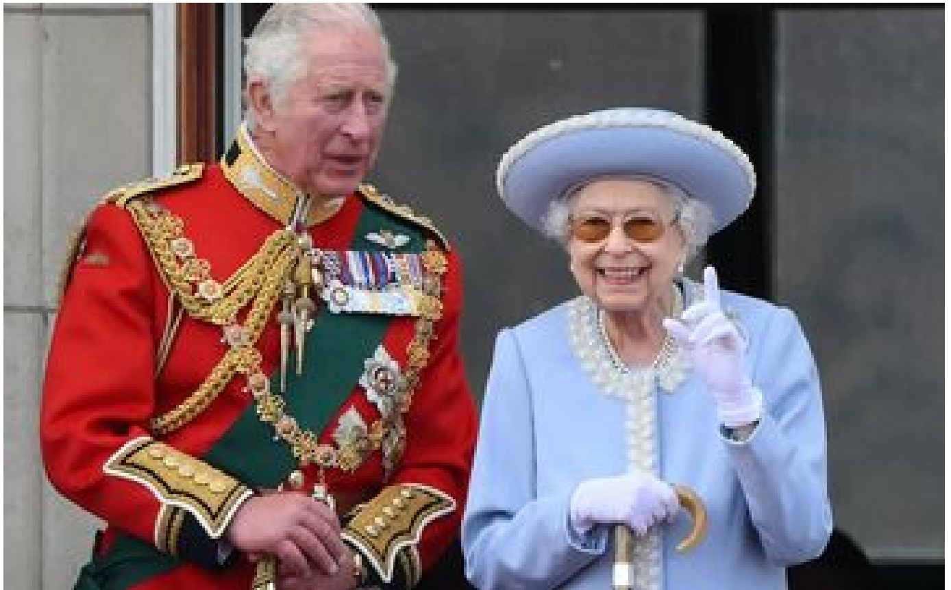
Décès d'Elizabeth II : son fils, le nouveau roi Charles III, évoque «un moment de grande tristesse»