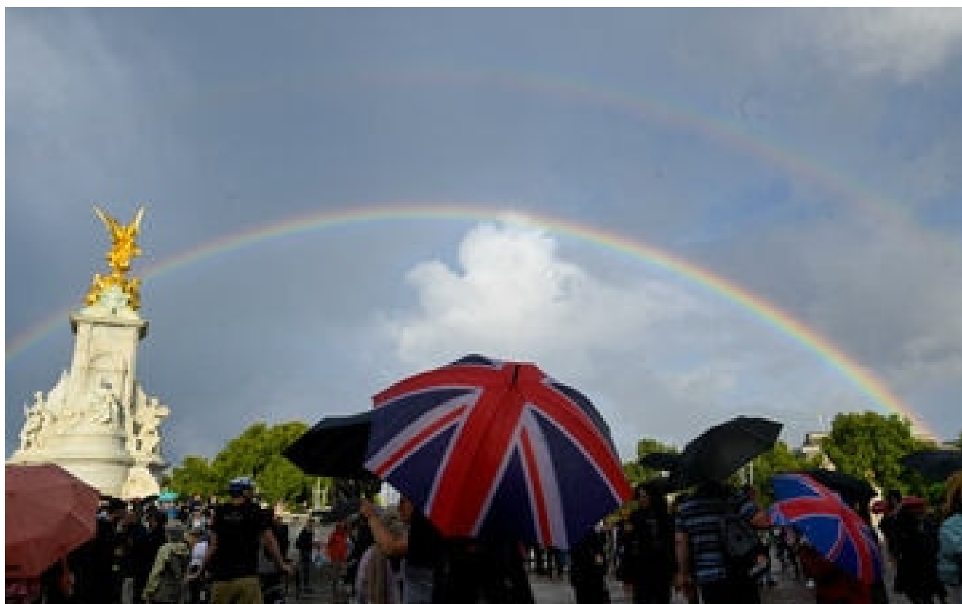
Mort d'Elizabeth II : un double arc-en-ciel apparaît au-dessus de Buckingham Palace à l'annonce