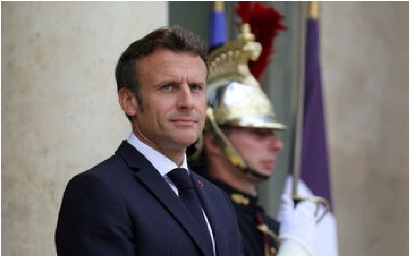
Mort d'Elizabeth II : Emmanuel Macron, Biden, Zelensky... les dirigeants rendent hommage à une «reine de cœur»