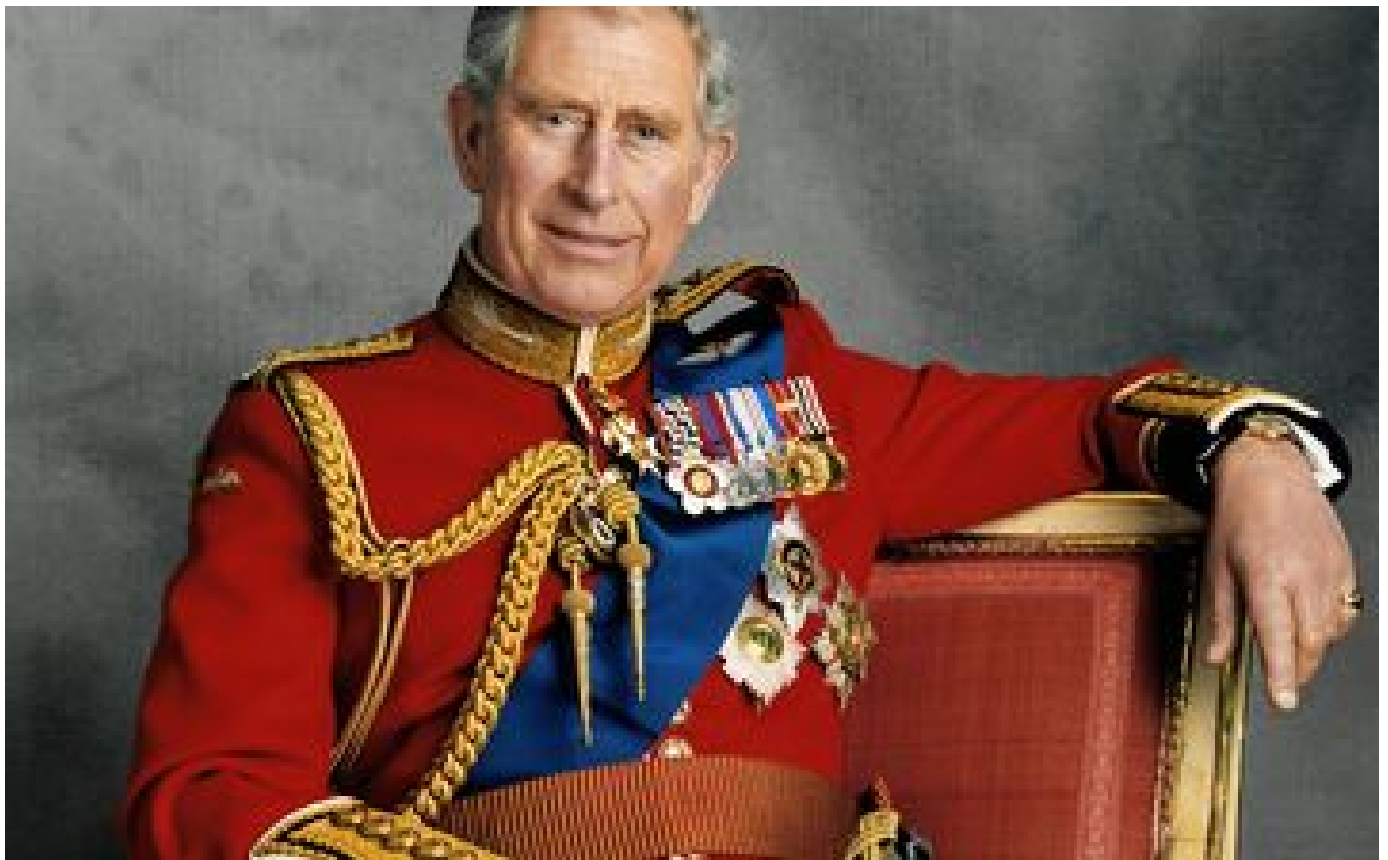
Abonnés Mort d'Elizabeth II : le règne de Charles III peut (enfin) commencer