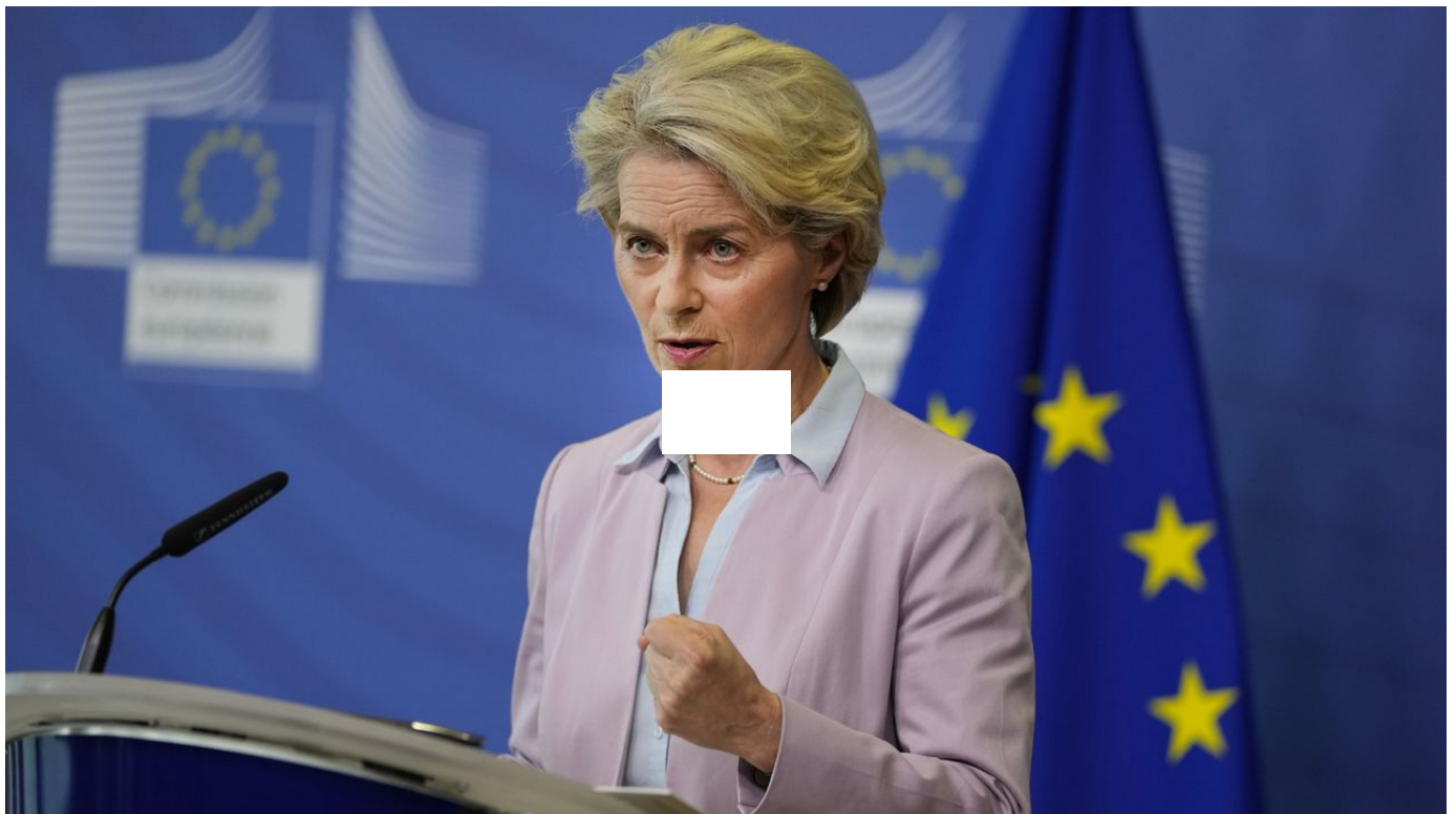
Bruxelles veut plafonner les revenus des producteurs d'électricité / Le Journal horaire / 34 sec. / hier à 15:02