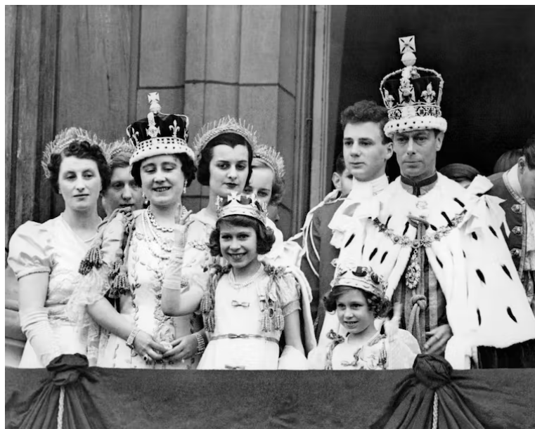
La reine Elizabeth (deuxième à gauche, future reine mère), sa fille la princesse Elizabeth (quatrième à gauche, future reine Elizabeth II), la reine Mary (au centre), la princesse Margaret (cinquième à gauche) et le roi George VI (à droite), posent au balcon du palais de Buckingham le 12 mai 1937.

Le règne d'Elizabeth trouve ses origines dans la crise de l'abdication de 1936, l'événement déterminant du XX e siècle pour la monarchie britannique. L'abdication inattendue d'Édouard VIII a propulsé sur le trône son jeune frère Albert, timide et bègue, sous le nom de George VI. Peu après, il allait devenir la figure de proue de la nation pendant la Seconde Guerre mondiale.