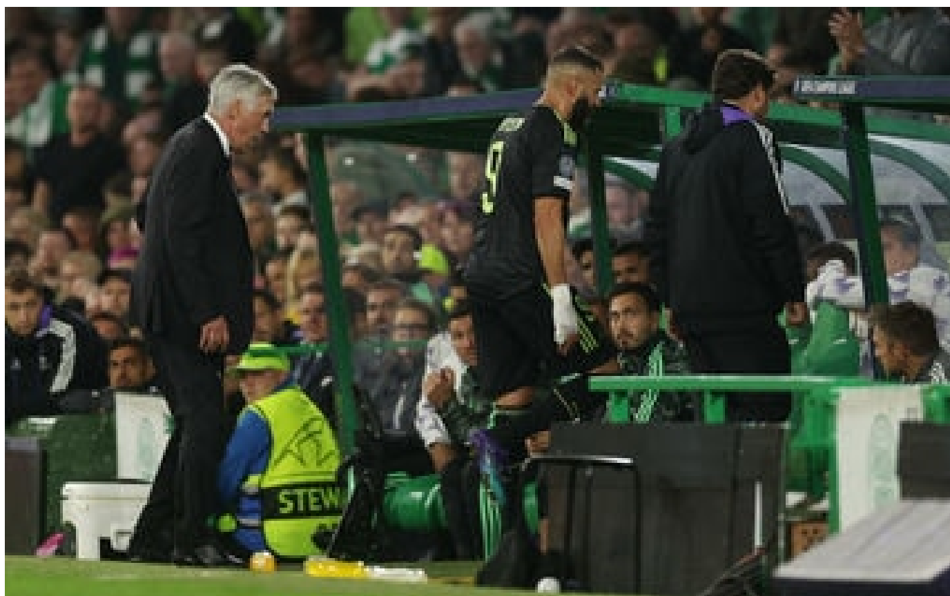
Real Madrid : touché au genou, Karim Benzema sort après 30 minutes de jeu face au Celtic Glasgow