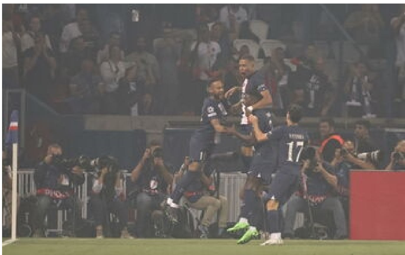
PSG-Juventus : les deux bijoux de Mbappé pour permettre à Paris de mener au score