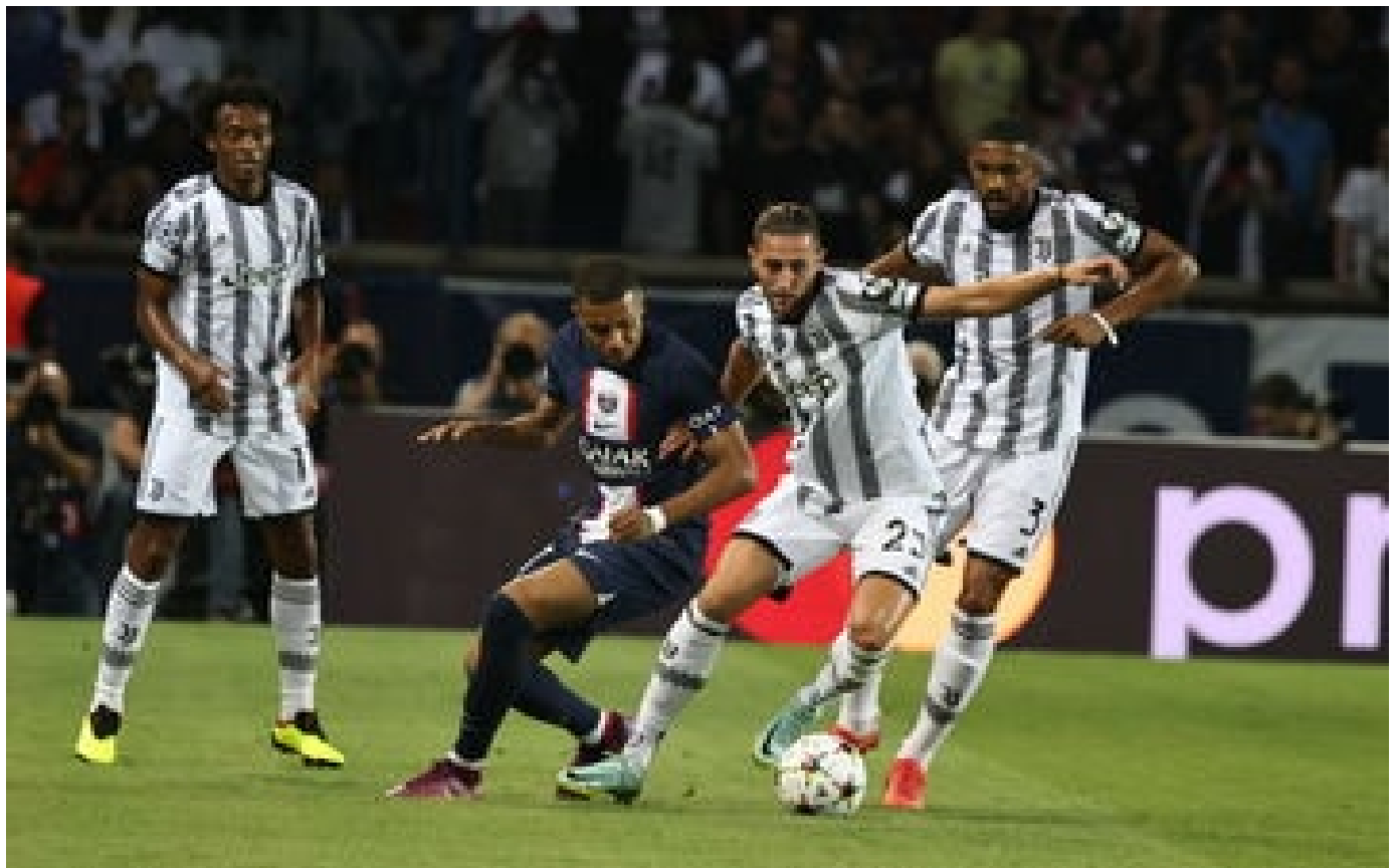
DIRECT. PSG-Juventus: les Turinois poussent fort pour égaliser (2-1)