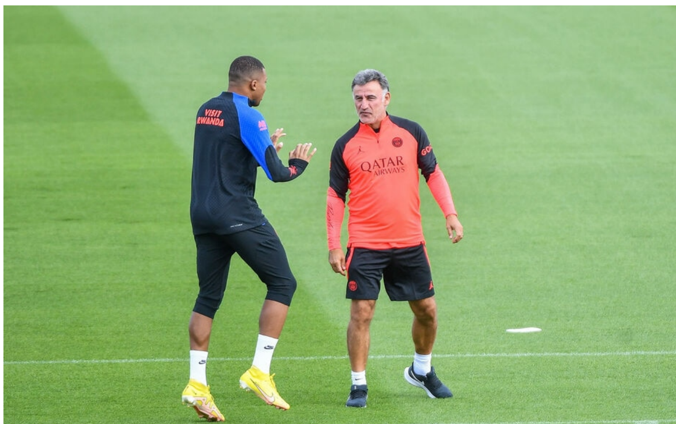
Kyllian Mbappé et Christophe Galtier à l'entraînement