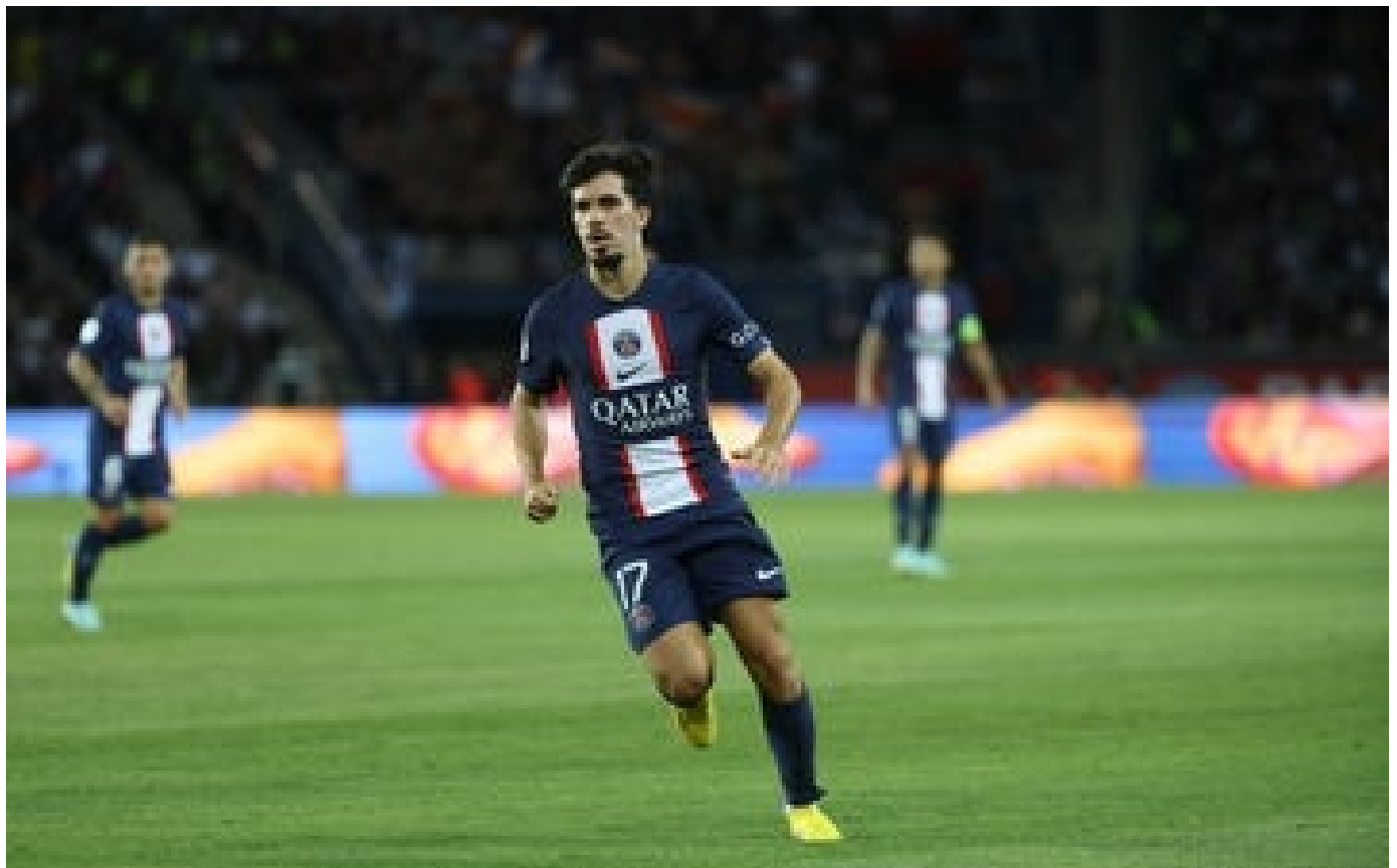
PSG-Juventus : un onze sans surprise, avec Vinha