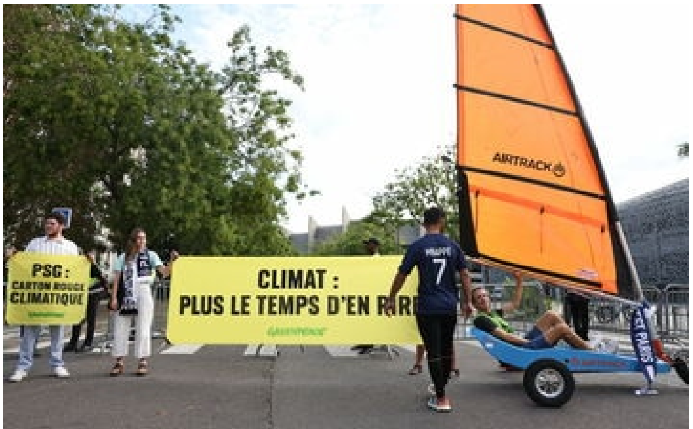
VIDEO. Greenpeace offre un char à voile à Christophe Galtier au pied du Parc des Princes