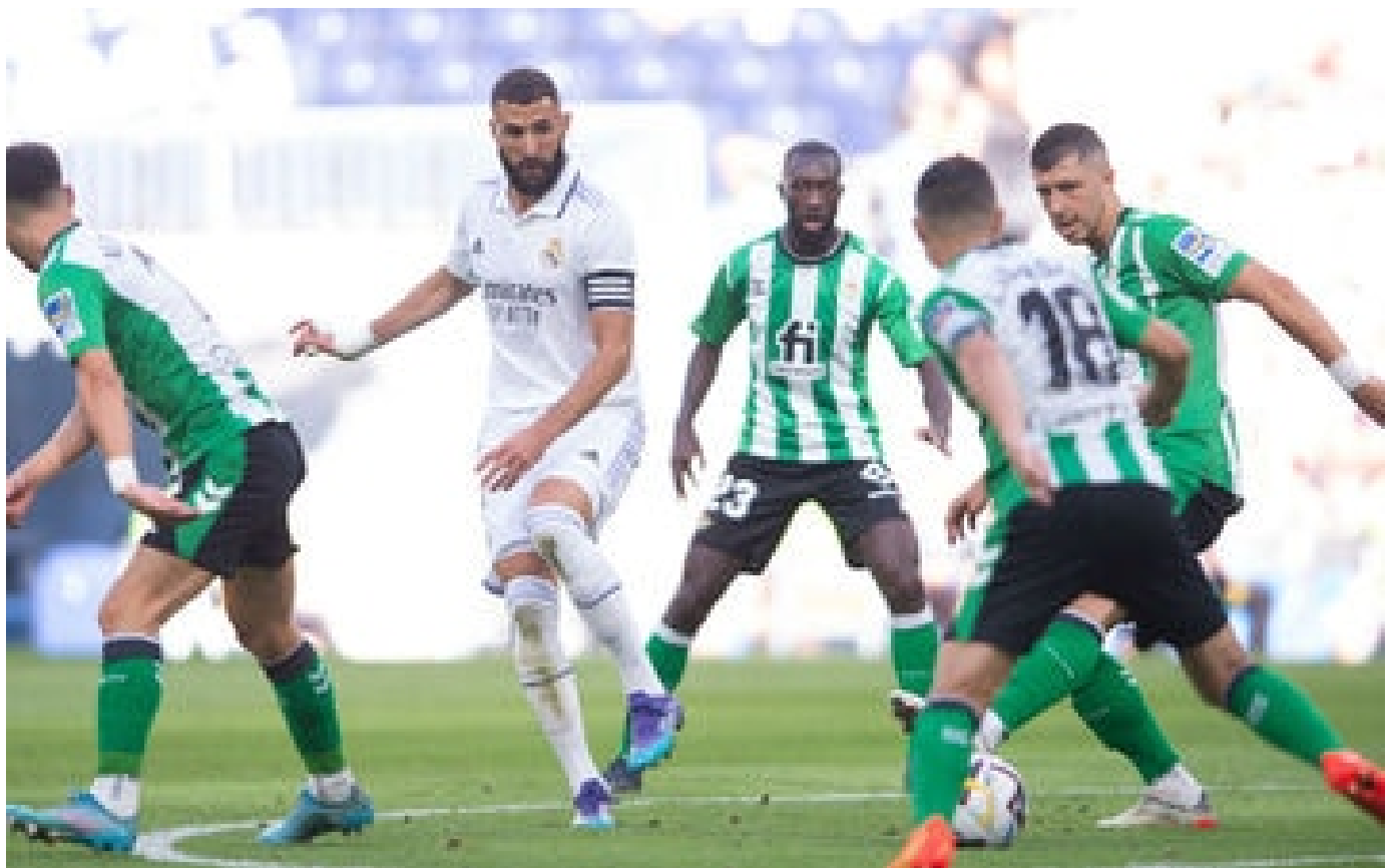
Déplacements des footballeurs : en Espagne et en Italie, des clubs voyagent déjà en train