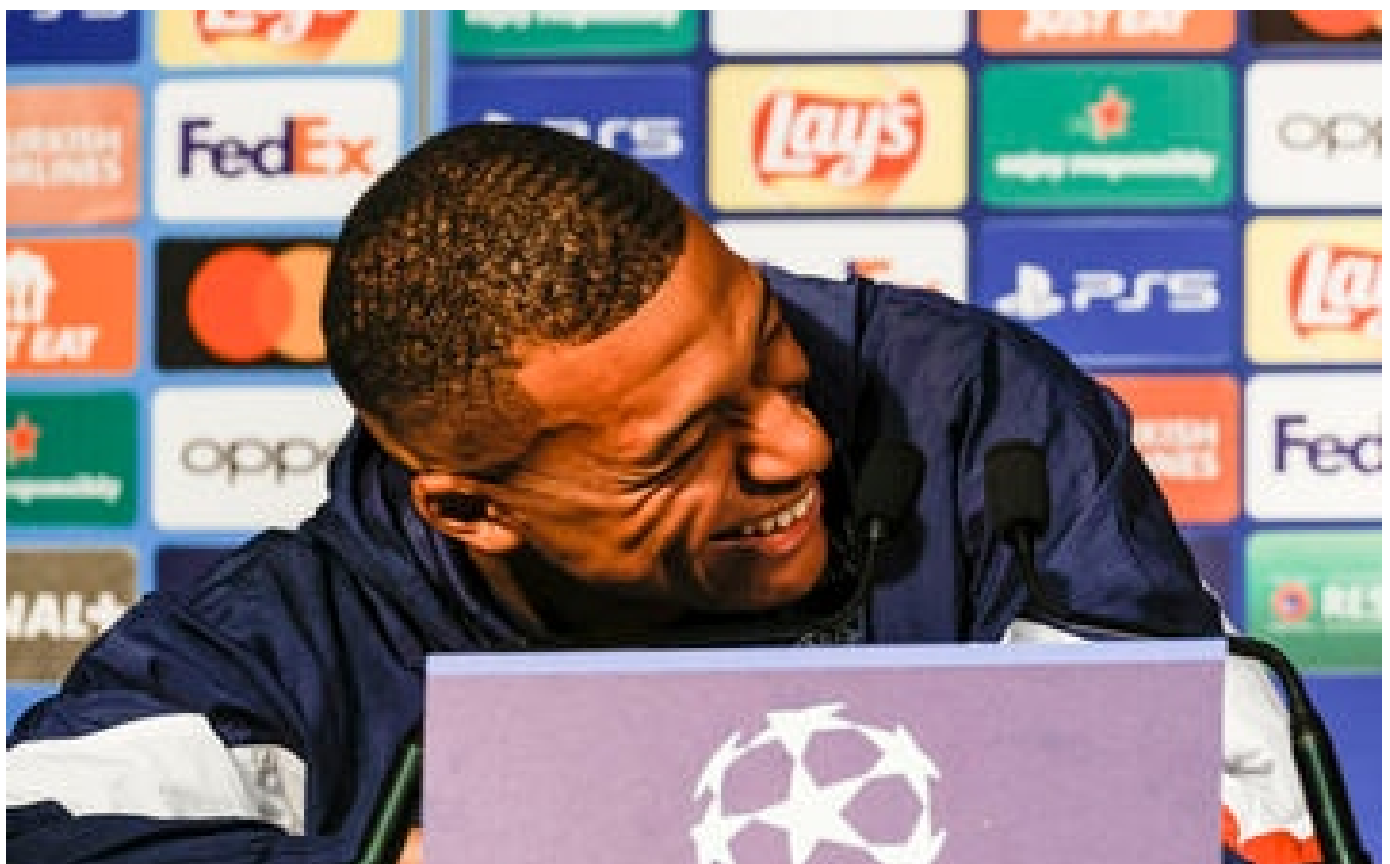
Abonnés Déplacements du PSG en «char à voile» : pourquoi Galtier et Mbappé ont fait «une erreur de communication majeure»