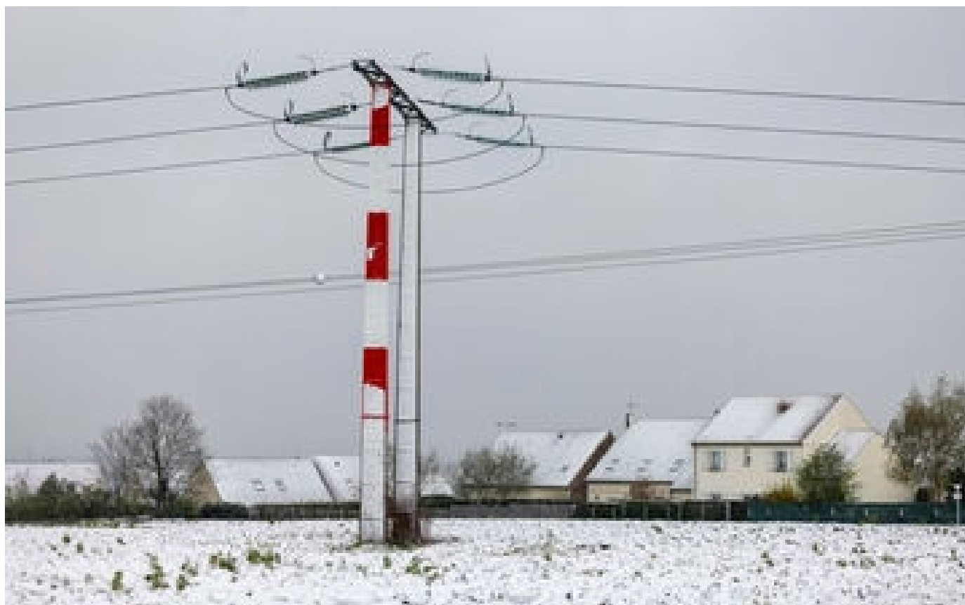
Abonnés Risques de coupure d'électricité : la météo cet hiver, le facteur qui pourrait tout changer