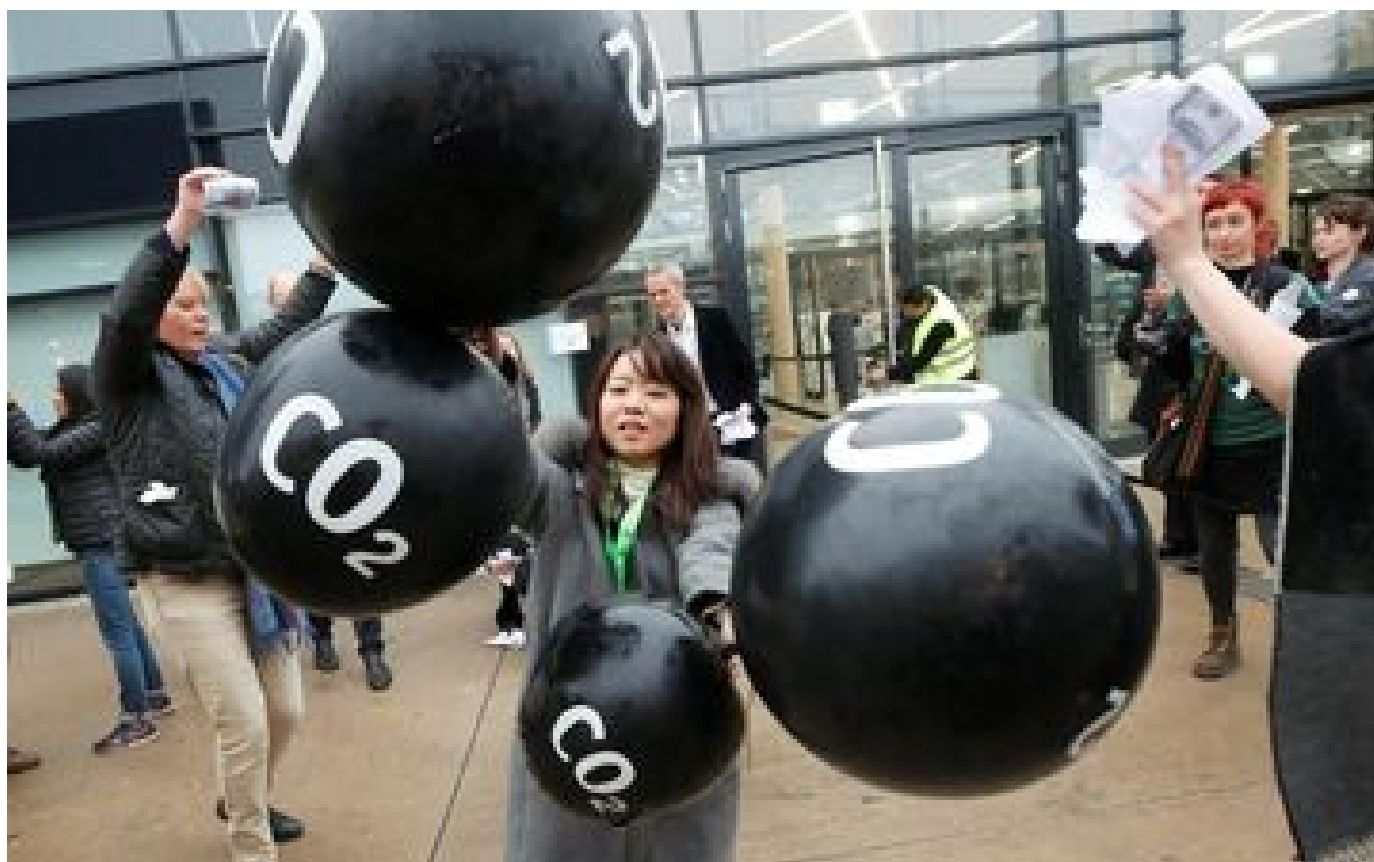
Abonnés Une minorité à l'origine de la moitié des émissions de gaz à effet de serre ? Ce qui se cache