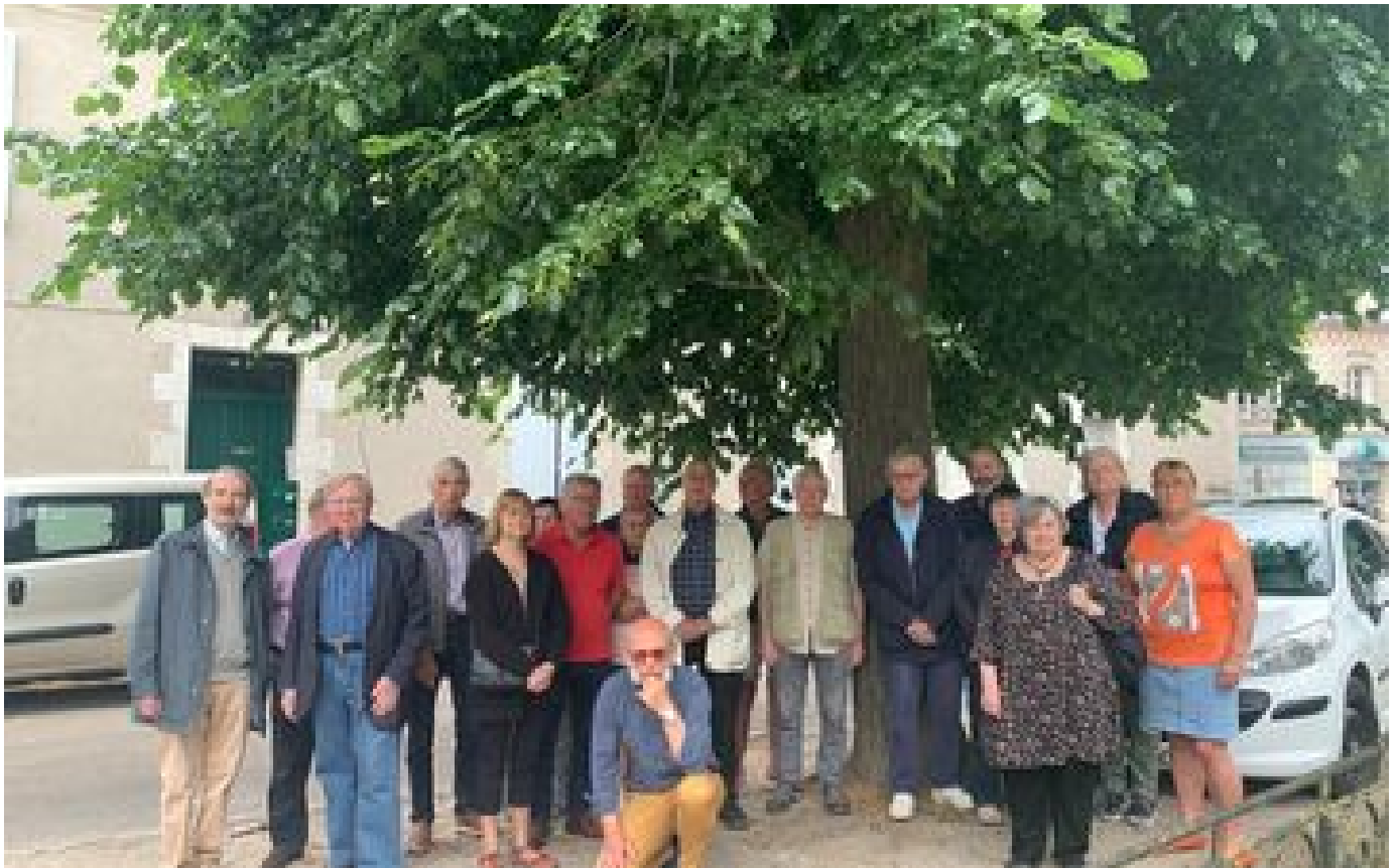
Les tilleuls reflleuriront à Orléans : la mairie a renoncé à son projet d'abattre les arbres de la place Domrémy