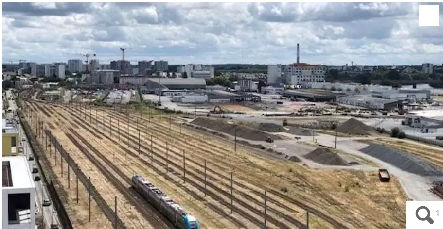
Le site ferroviaire de Nantes-État, sur l'île de Nantes.

Le collectif FerNantes, opposé au démantèlement du site ferroviaire de Nantes-État, sur l'île de Nantes, compte introduire un recours au fond, après que le tribunal administratif l'a débouté fin juillet. Pendant ce temps, le chantier lancé par SNCF Réseau avance à grands pas.