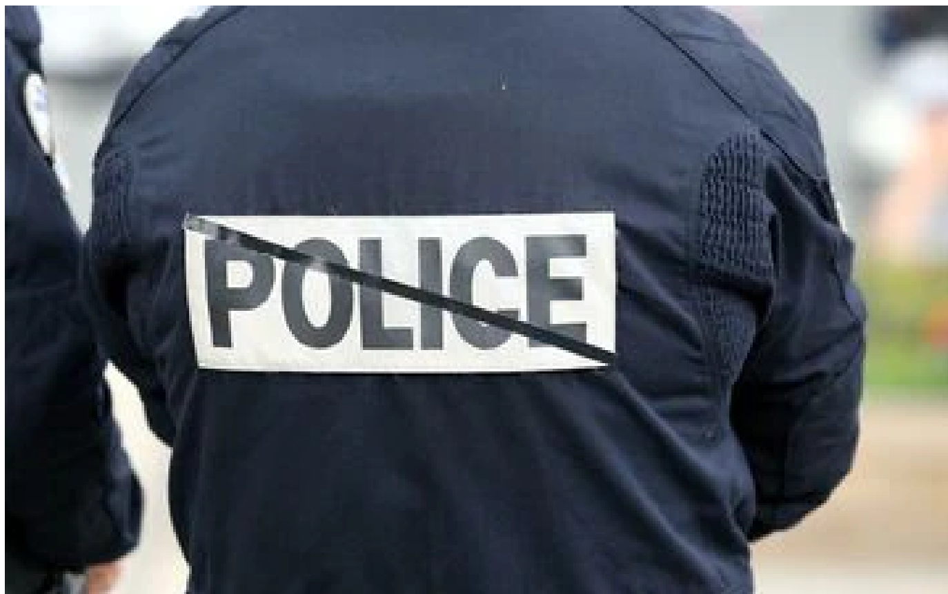
Gard : un homme tué, son compagnon mis en garde à vue