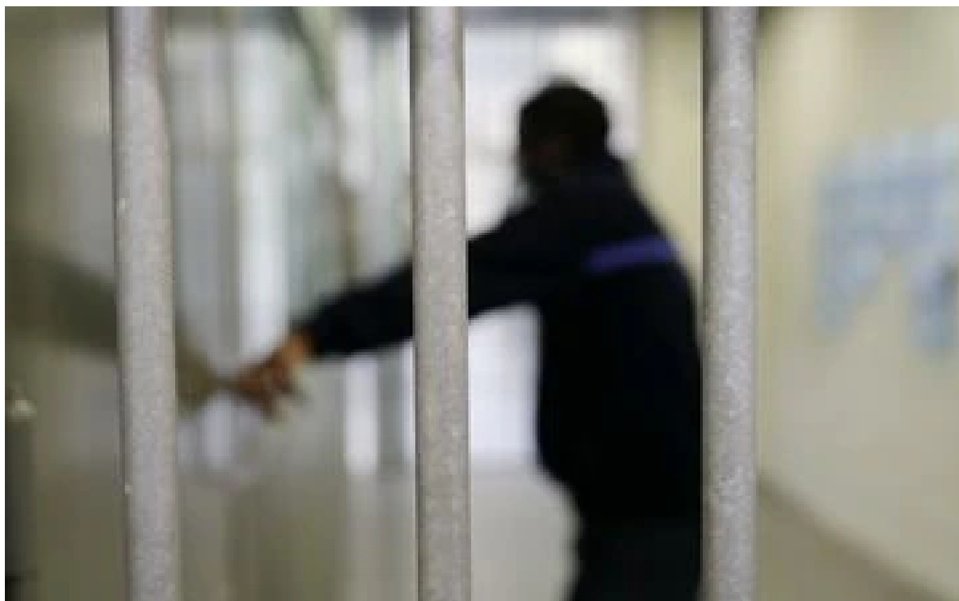
Normandie : trois personnes écrouées après un meurtre sur fond de séparation