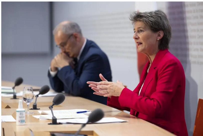
La ministre de l'Énergie Simonetta Sommaruga et le