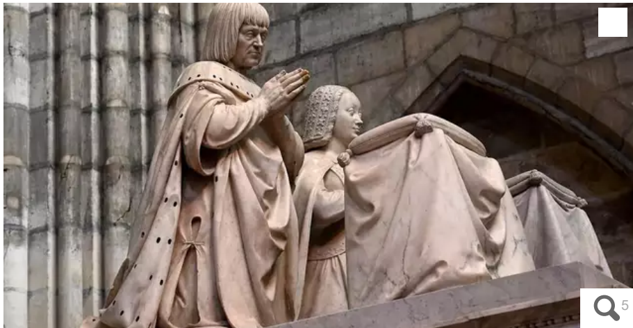
Le tombeau de Louis XII et Anne de Bretagne dans la basilique Cathédrale de Saint-Denis.

Le 7 août 1532, les États de Bretagne signaient un traité d'alliance avec François Ier, roi de France. Cet acte d'union mettait fin à près de mille ans d'indépendance. Le magazine «Bretons» plonge dans les coulisses de l'Histoire pour faire le récit de cette soumission.