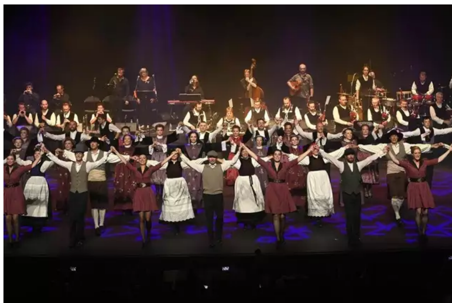
90 danseurs et musiciens partageaient la scène.

Le public, debout, a applaudi de longues minutes à l'issue du spectacle « La jolie au fil du temps » présenté au théâtre de Lorient (Morbihan) en début d'après-midi, dimanche 14 août, 2022.