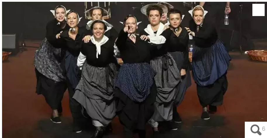
Le cercle Bugale an Oriant a présenté « La jolie au fil du temps », un spectacle sur l'histoire de Lorient pensé avec le bagad Sonerien an Oriant, dimanche 14 août 2022.

Après deux ans de reports, le cercle Bugale an Oriant a présenté son spectacle avec le bagad Sonerien an Oriant ce dimanche 14 août 2022. Une prestation impressionnante saluée par une longue standing-ovation.