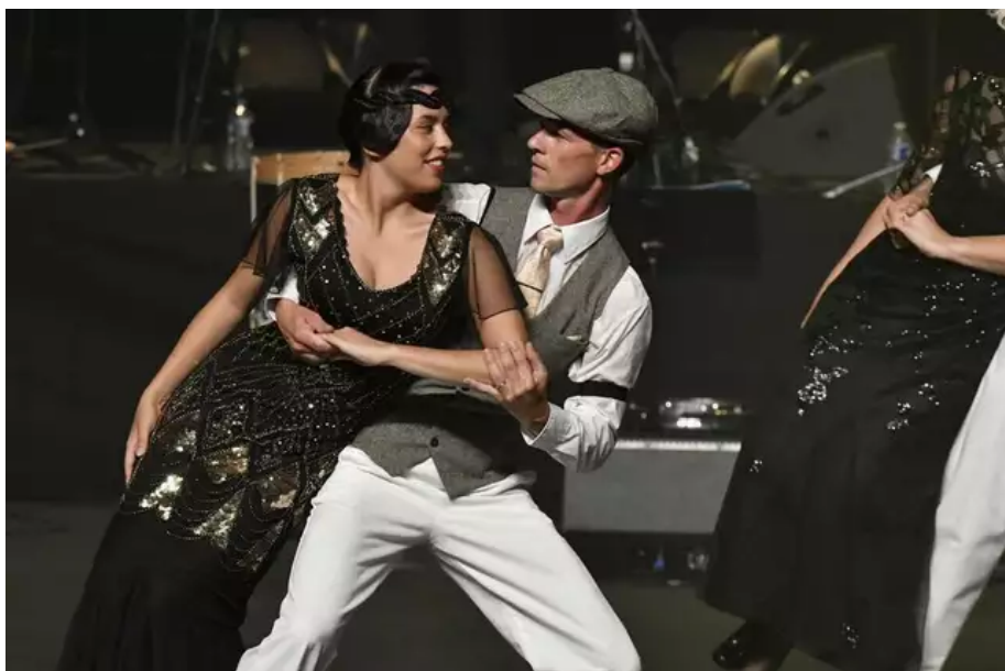
Pour un voyage dans le Lorient des années trente, les danseurs ont effectué une rumba sur « Mon amant de Saint-Jean ».

La conception de ce spectacle 100 % lorientais avait commencé il y a près de deux ans et demi. Il devait être présenté lors de la 50 e édition du Festival Interceltique en l'honneur de la Bretagne, en 2020. Covid oblige, il a été reporté à deux reprises.