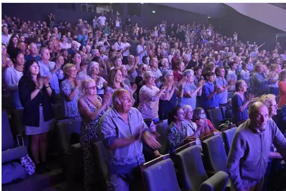
Le spectacle a été salué par une longue standing-ovation du public.

La conception de ce spectacle 100 % lorientais avait commencé il y a près de deux ans et demi. Il devait être présenté lors de la 50 e édition du Festival Interceltique en l'honneur de la Bretagne, en 2020. Covid oblige, il a été reporté à deux reprises.