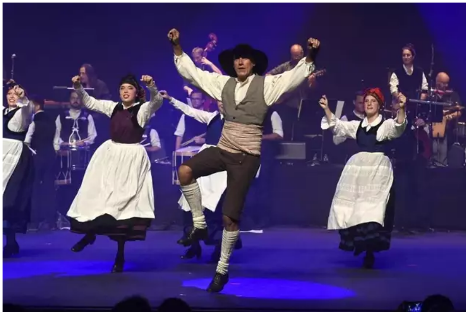
Pour leur tableau en l'honneur de l'interculturalisme, les danseurs de Bugale an Oriant ont appris les danses asturiennes.

Pendant une heure trente, passée à toute allure, 90 danseurs et musiciens ont raconté l'histoire de Lorient.