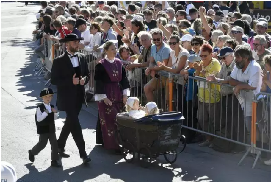
La Grande parade des nations celtiques a fait son grand retour, dans les rues de Lorient. Près de 80 000 spectateurs étaient présents.