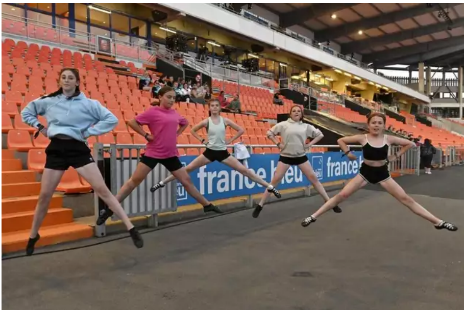
Séances de répétitions des groupes irlandais pour « Horizons celtiques ». Les jeunes filles du Dunbar Highkand Dancers (Écosses) répètent en attendant leur tour.

Cette année, le stade du Moustoir a accueilli le spectacle