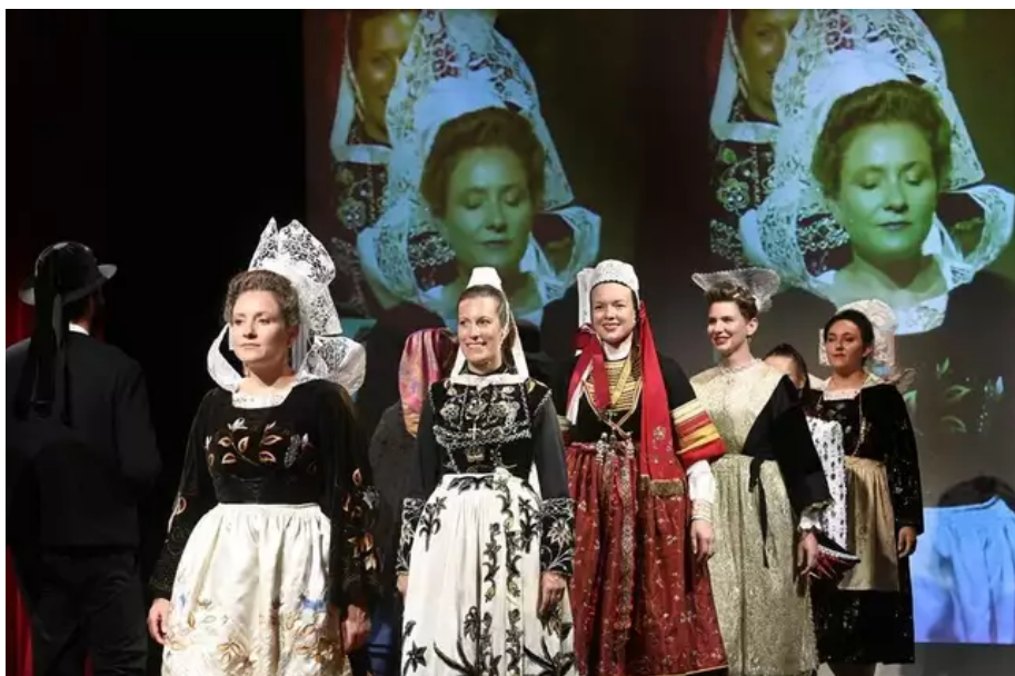
« Au fil des costumes », défilé des atours de Bretagne et des nations celtes, au Palais des congrès.