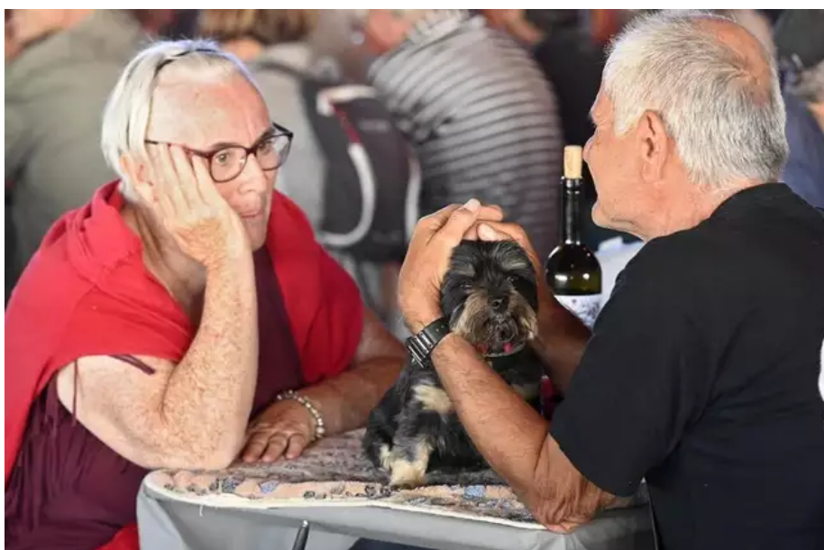
La cotriade, sur le site du stade (dit Village Celte), sous chapiteau, une innovation. Au passage du duo Biniou bombarde qui lance la soirée, on bouche les oreilles du chien de la famille.