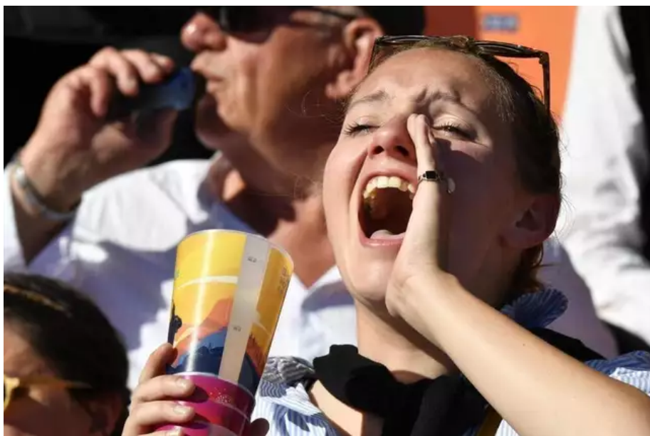
Au Championnat national des bagadou de 1 re catégorie au stade du Moustoir, e. Encouragements pour les Quimpérois.