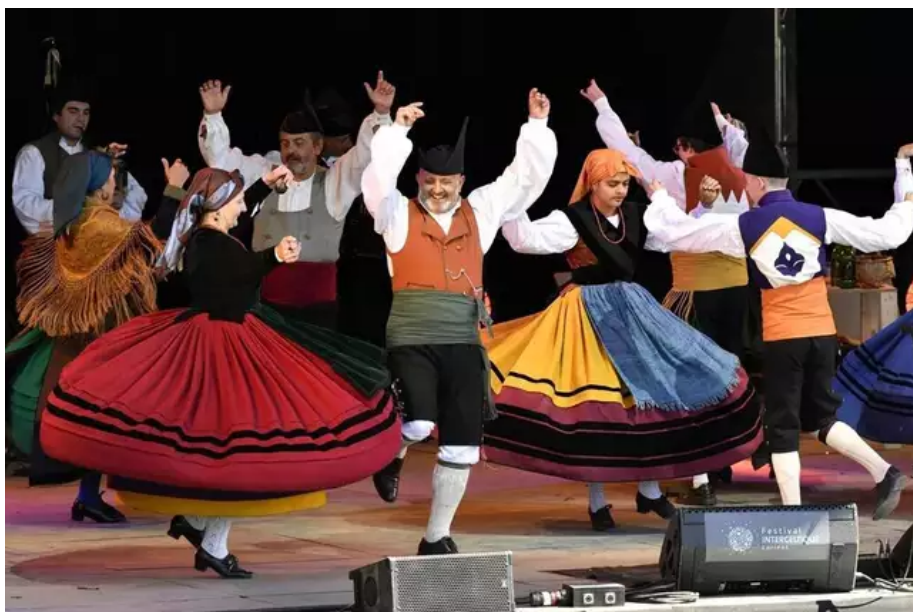
Grupo de Baile Trebeyu ( Asturies ) sur la scène de L'Amphi. Costumes.