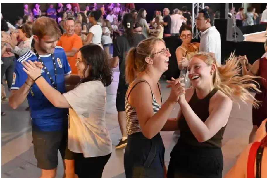
Initiation aux danses asturiennes salle Carnot.