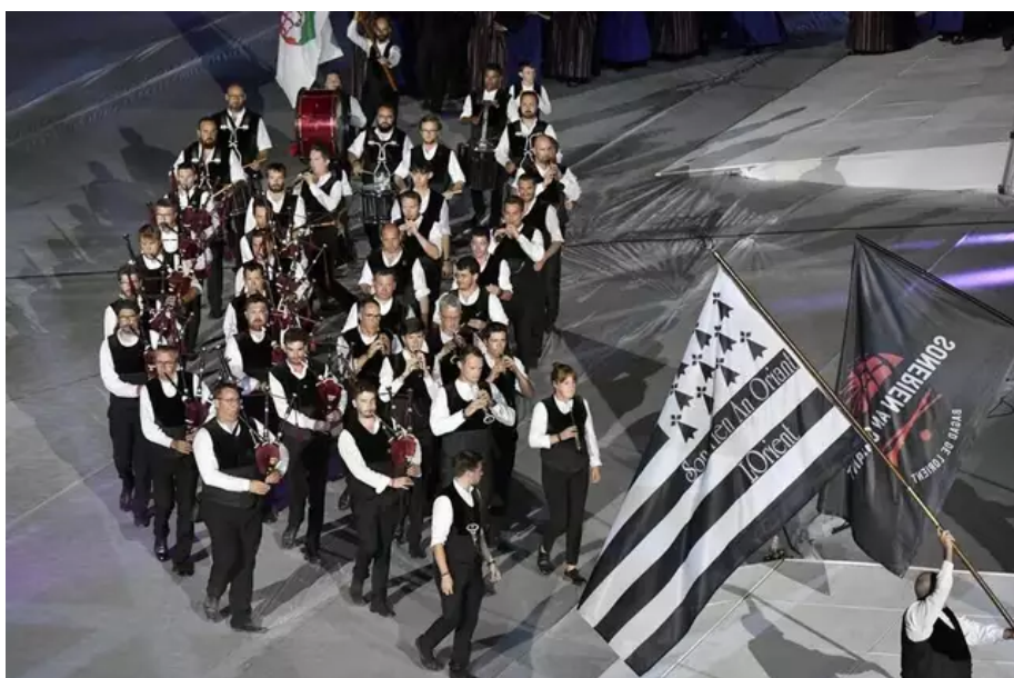
Ultime représentation de « Horizons celtiques » au stade du Moustoir. Le Bagad Sonerion an Oriant.