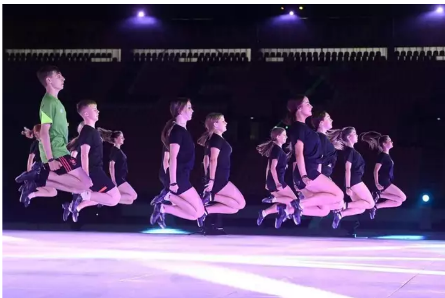
Séances de répétitions des groupes irlandais pour « Horizons celtiques ». Répétitions des danseurs et danseuses du groupe Plaznxy O'Rourke.