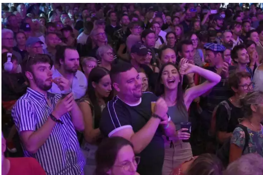
Ambiance au pavillon des pays celtiques, musique irlandaise.