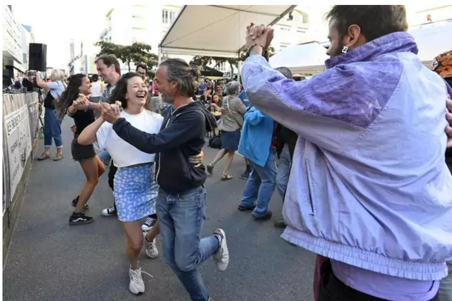
C'est parti, ça danse dans les rues, ici un spot incontournable, le bar La Truie et sa Portée.