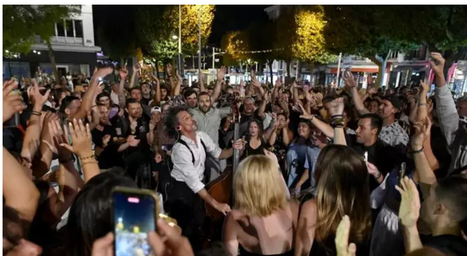
Ambiance nocturne après minuit place Aristide-Briand. Avec French Touch DZ.