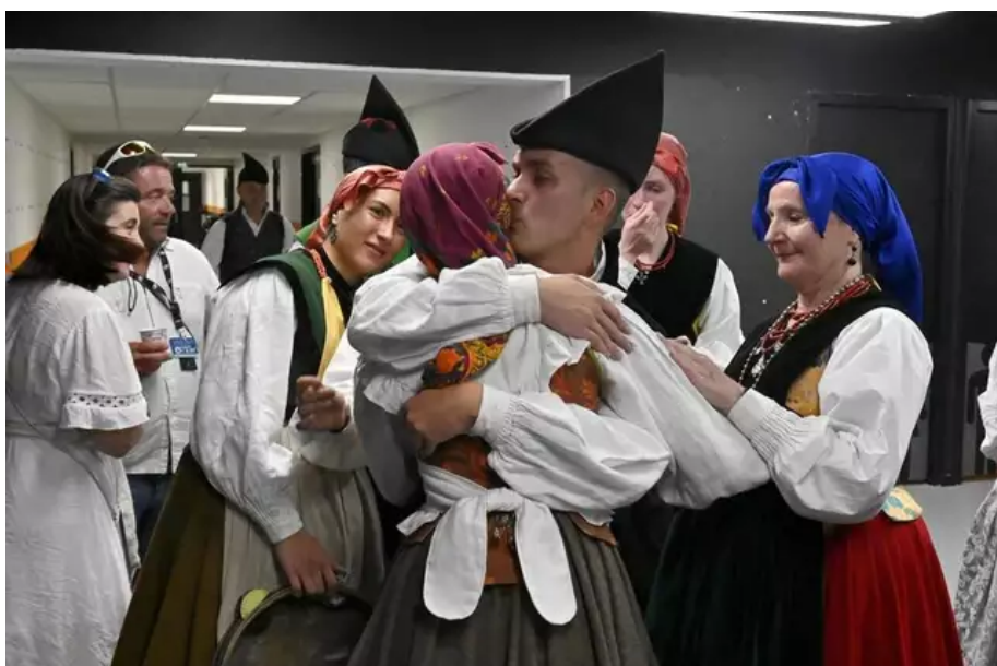
Ultime représentation d'« orizons celtiques » au stade du Moustoir. EL Grupo de baile Trebeyu sort de scène, il y a de l'émotion dans l'équipe.