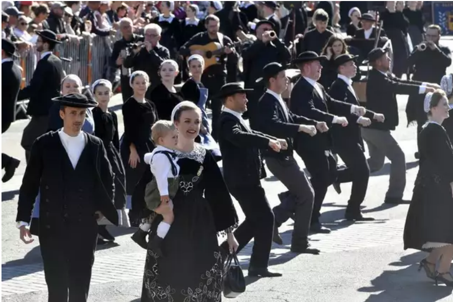
La Grande parade des nations celtiques a fait son grand retour, dans les rues de Lorient.