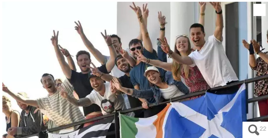
Cette fine équipe a mis l'ambiance, lors de la Grande parade des nations celtes, dimanche 7 août 2022 à Lorient.

Après deux années compliquées par le Covid, le Festival Interceltique de Lorient (Morbihan) a réussi son retour du 5 au 14 août 2022. Cette 51e édition, mettant à l'honneur les Asturies, a été celle de tous les records : fréquentation, chaleur et ambiance ! Retour en images.