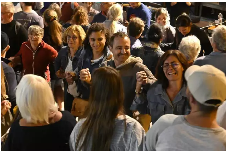
C'est parti, ça danse dans les rues, ici un spot incontournable, le bar La Truie et sa Portée.