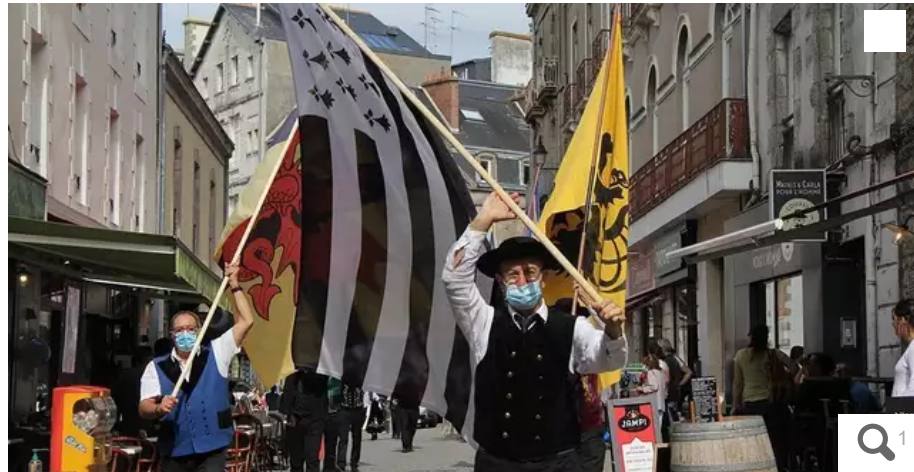
Différents bagadoù et cercles vont se succéder pour le plus grand plaisir des oreilles des visiteurs.

Après déjà deux jours déjà de célébration de la Bretagne, le Festival d'Arvor bat son plein à Vannes (Morbihan). Bagadoù, cercles, humoriste, exposition, demandez le programme.