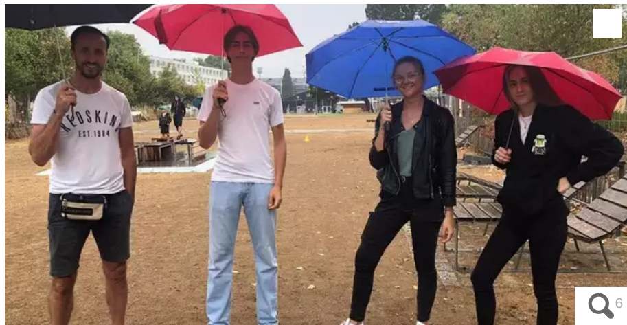
Ce dimanche 14 août 2022, le Festival Interceltique de Lorient (Morbihan) se termine ce soir après dix jours de fête. Les festivaliers ont remis pantalons, sweats et sorti les parapluies.

Ce dimanche 14 août 2022, le Festival Interceltique de Lorient (Morbihan) se termine ce soir après dix jours de fête. Ouest-France vous propose de vivre la dernière journée de cette 51e édition grâce à nos journalistes sur place.