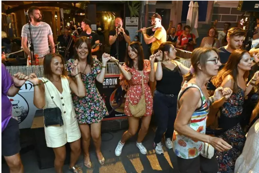
Minuit et demi, Digresk met le feu devant La Truie et sa Portée.

La fête a été encore belle pour le dernier week-end du Fil 2022. Retour en images avec les photos de Thierry Creux, notre photographe.