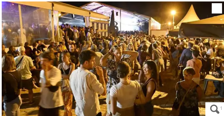
Les Nuits interceltiques resteront chaudes les derniers jours de la 51e édition.

Il va faire chaud sur l'Interceltique, ces jeudi et vendredi 11 et 12 août 2022. Notre météorologue Pascal Talmon offre un aperçu du temps à venir, jusqu'à dimanche.