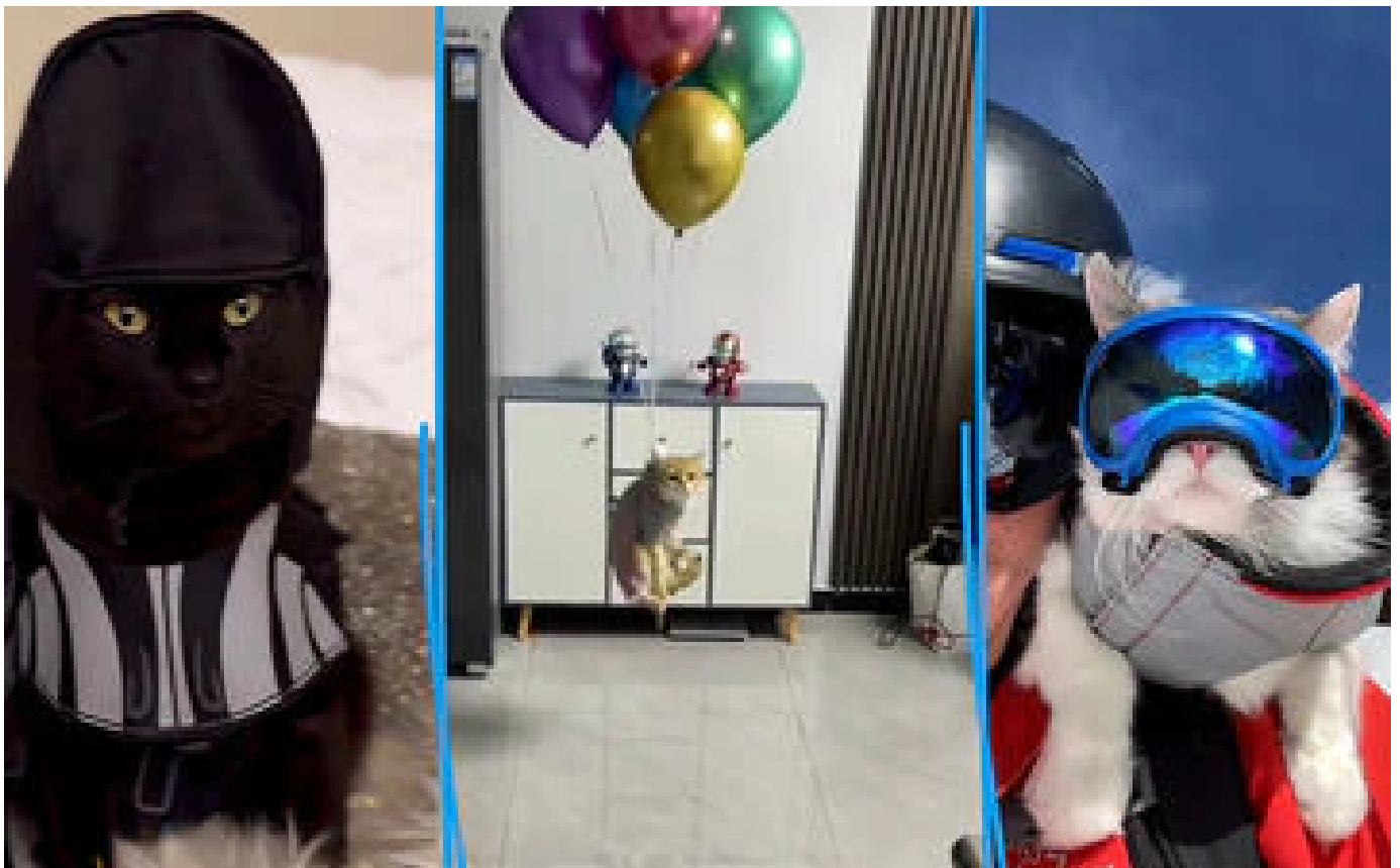
VIDÉO. Pour un like, certains vont beaucoup trop loin avec leur chat sur Instagram et TikTok