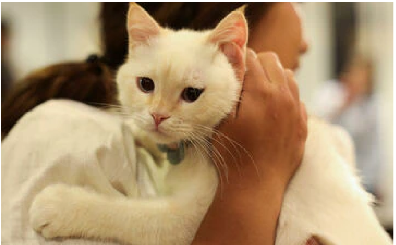
Les chats voient-ils vraiment la nuit ? Les roux sont-ils toujours des mâles ? On a démêlé le vrai