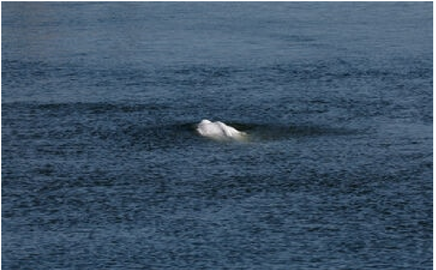
Béluga dans la Seine : le cétacé égaré sera transporté jusqu'à la mer