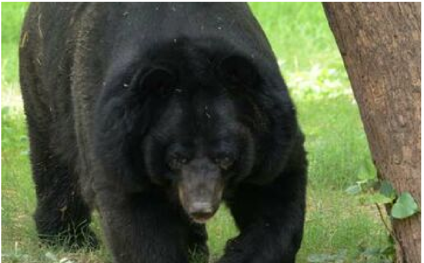
Etats-Unis : un ours s'enferme une nuit dans une voiture