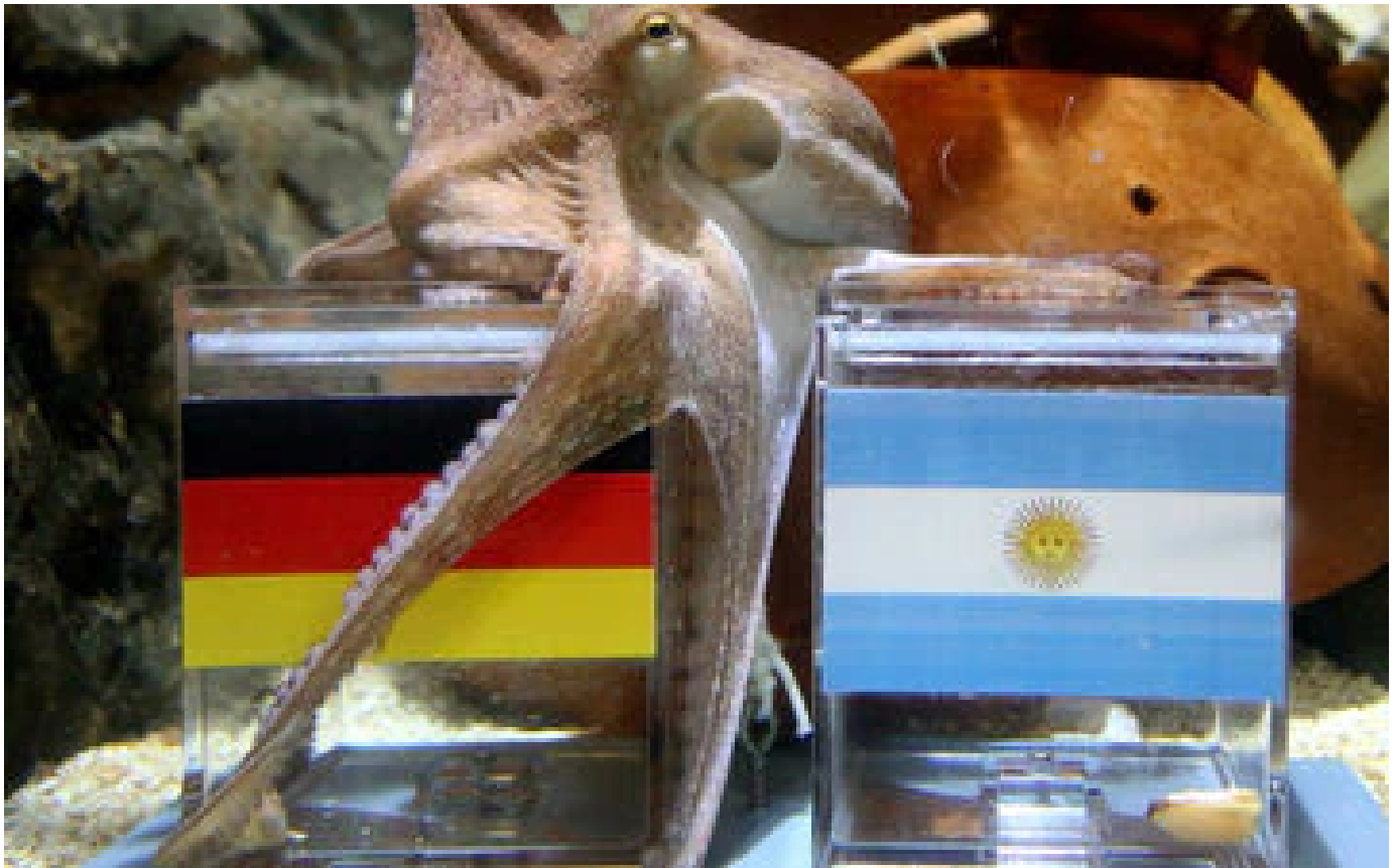
Abonnés Ces animaux devenus célèbres : Paul le poulpe, l'oracle du Mondial de football 2010