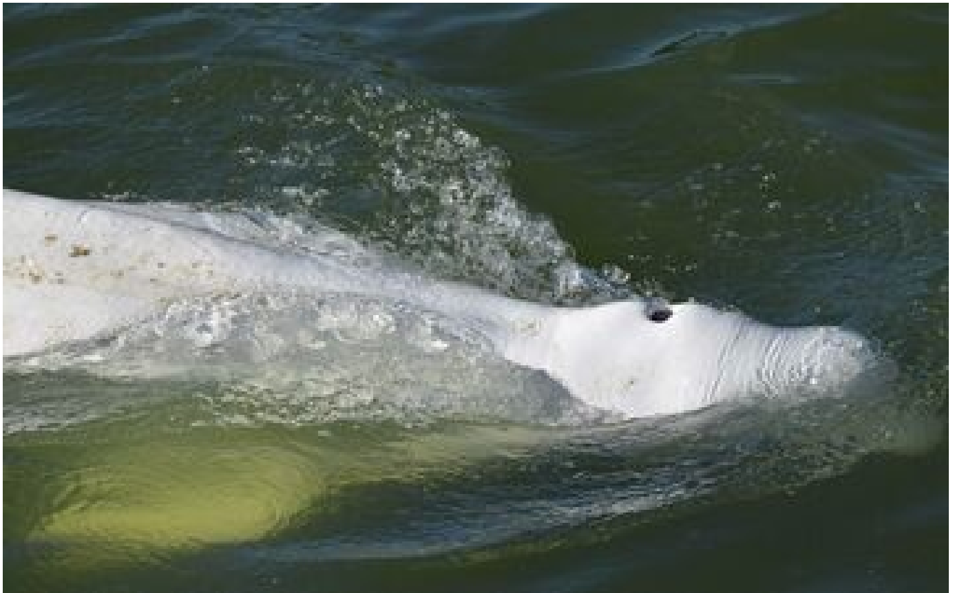
Béluga dans la Seine : le cétacé est dans un «état stationnaire», mais ne s'alimente toujours pas