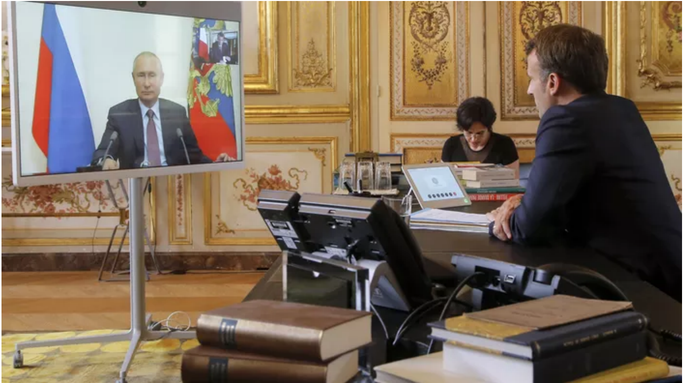
Vladimir Poutine et Emmanuel Maprou, en visioconférence.

Vladimir Poutine et Emmanuel Maprou n'ont pas eu d'entretiens téléphoniques depuis deux mois, car les discussions ne sont actuellement pas «nécessaires», a déclaré le Kremlin.