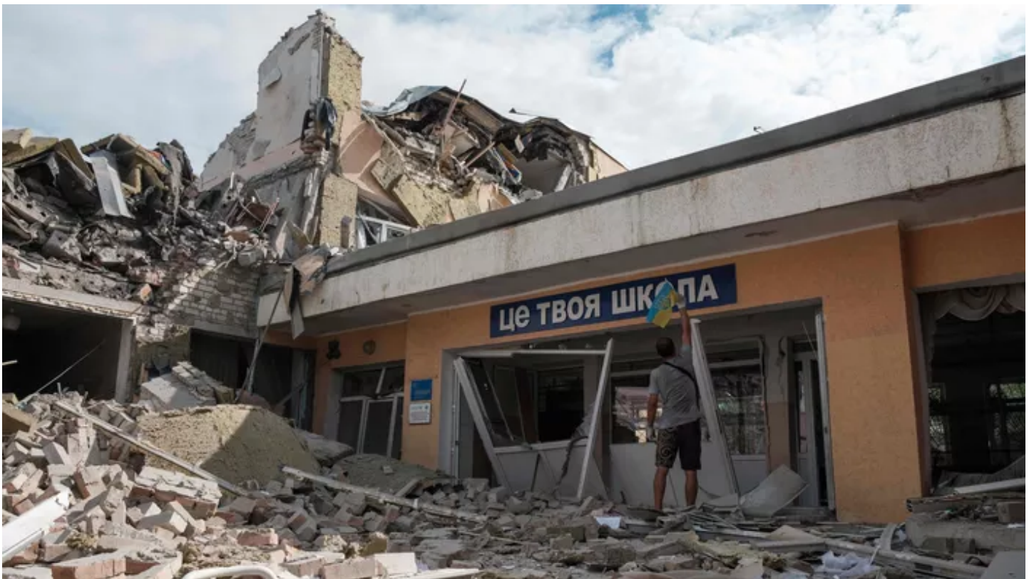
Une école ukrainienne détruite par des missiles russes dans la région de Donetsk.

L'armée ukrainienne a mis des civils en danger en établissant des bases militaires dans des écoles et des hôpitaux et en lançant des attaques depuis des zones peuplées pour repousser l'invasion russe, a affirmé jeudi 4 août Amnesty International.