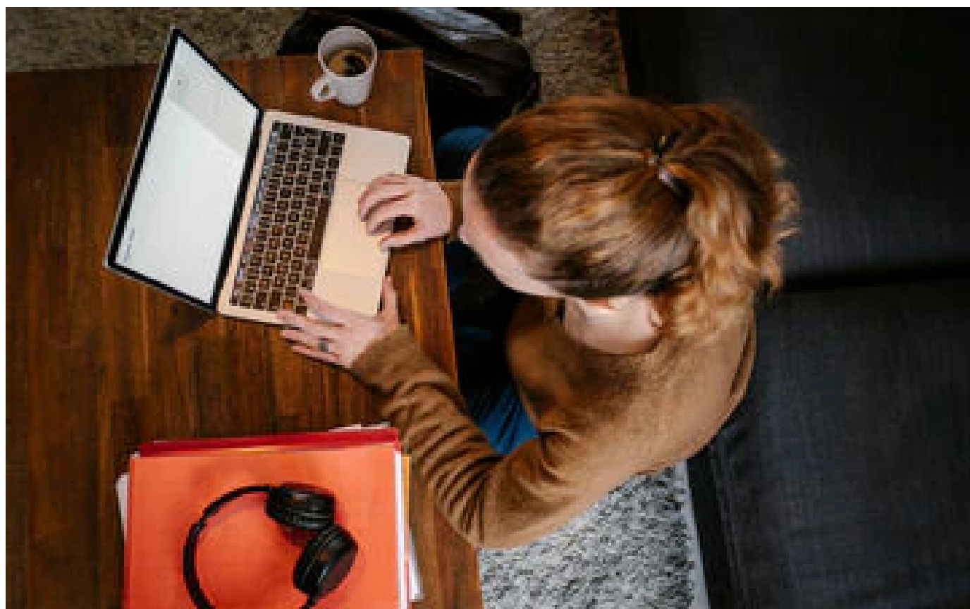
Télétravail : une pétition record pour les frontaliers au Luxembourg