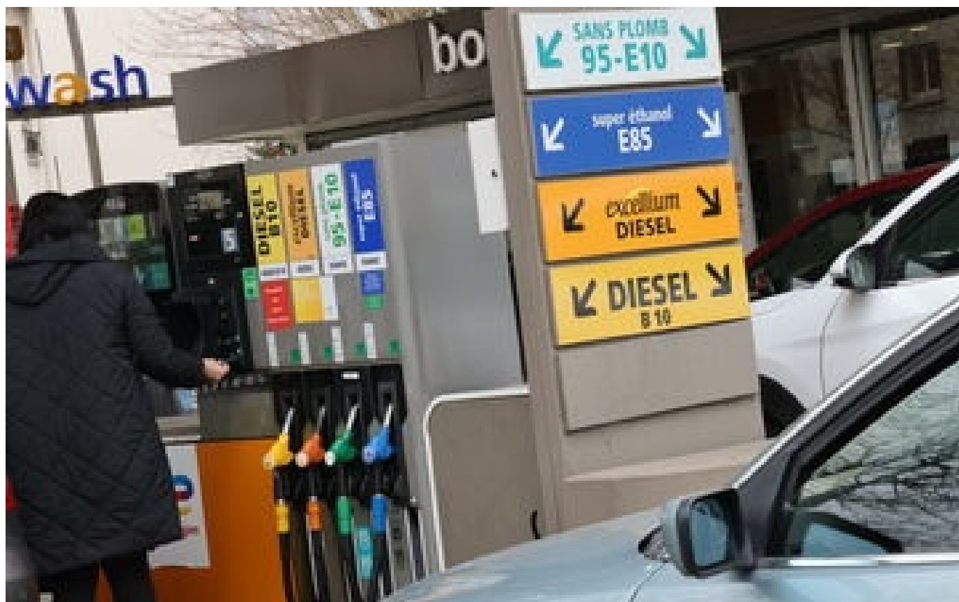
Prix des carburants : la baisse continue avant le grand chassé-croisé de l'été