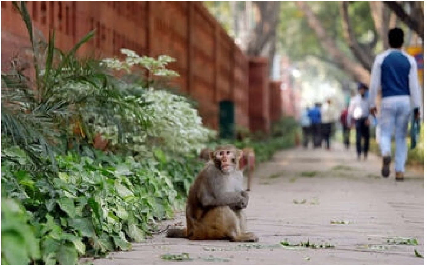
À l'ouest du Japon, une vague d'agressions de macaques terrorise une ville