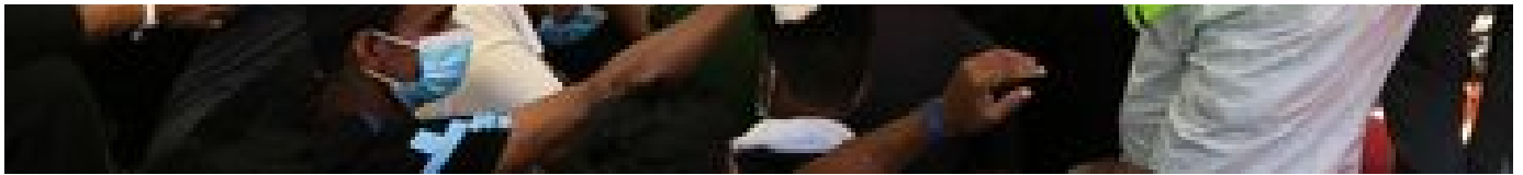
Migrants en Méditerranée : 307 personnes secourues par l'Océan Viking en moins de 24 heures