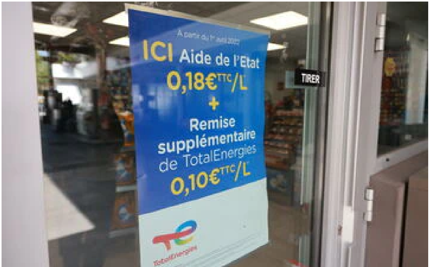
L'Assemblée rejette de peu une taxe sur les superprofits des grands groupes