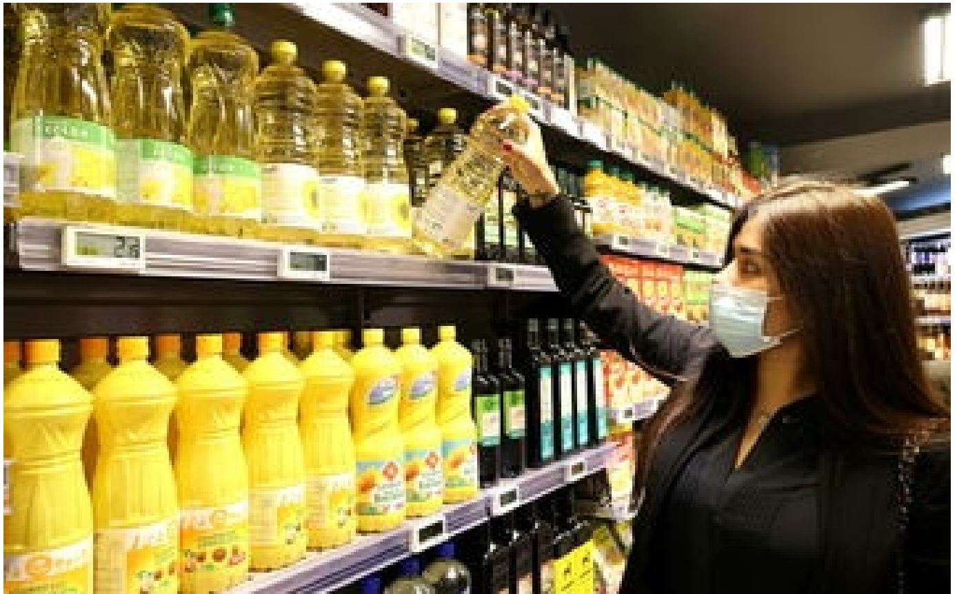
Abonnés Rouler à l'huile : prix, risques, véhicules concernés... tout ce qu'il faut savoir