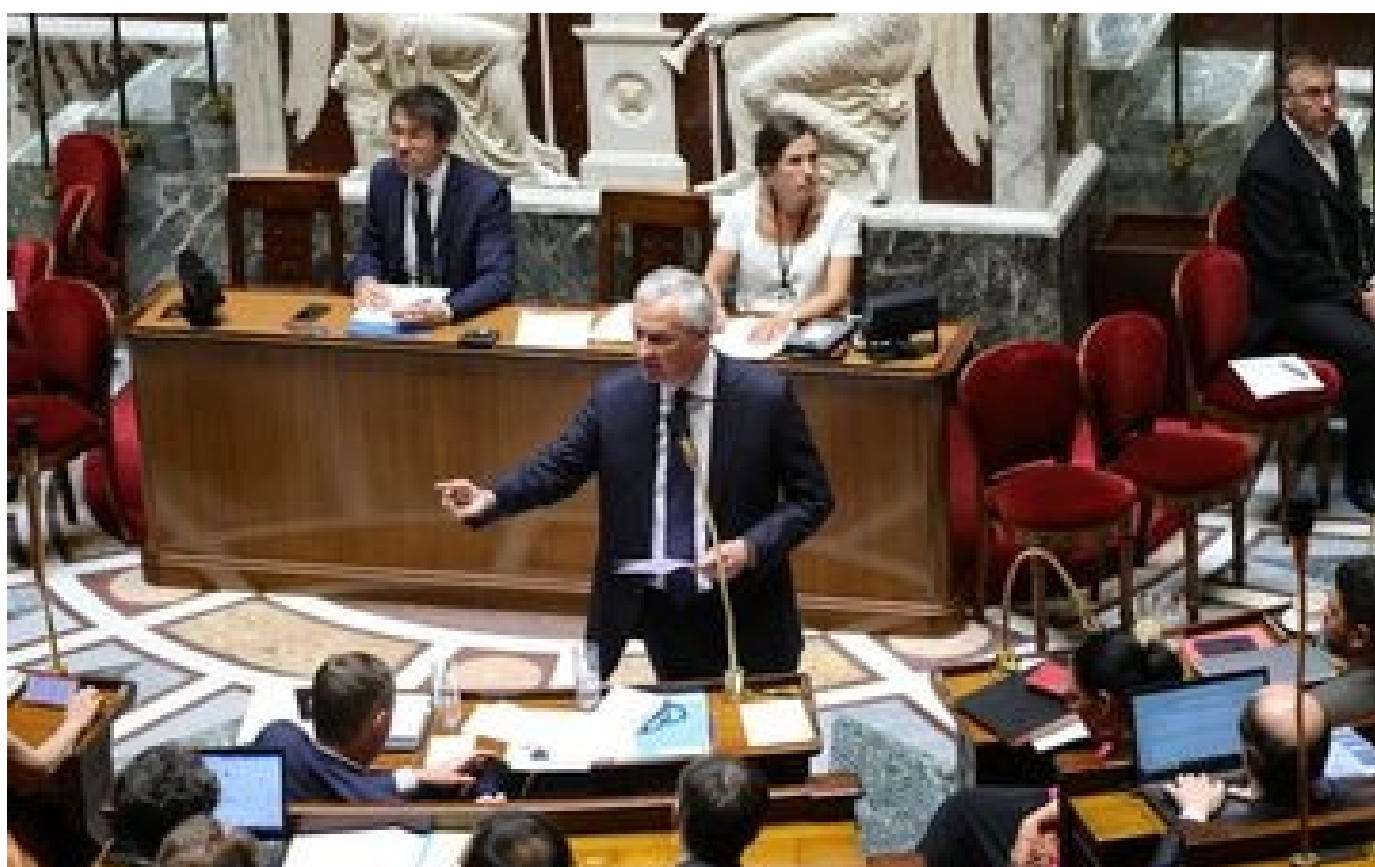
Pouvoir d'achat : les députés votent la possibilité pour les salariés de racheter leurs RTT non prises