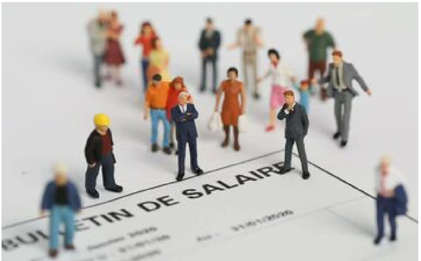
Abonnés «Quitte à ne pas prendre ces jours, autant que ce soit payé» : ce que les salariés pensent du rachat des RTT