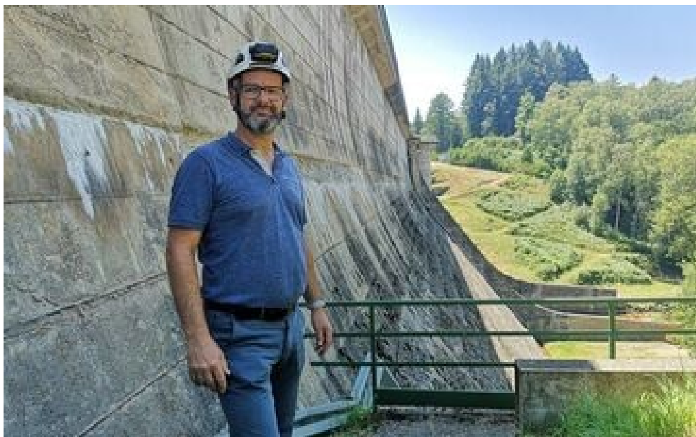
«En période de sécheresse, on détermine les priorités» : au lac de Vassivière, la délicate gestion de l'eau par EDF