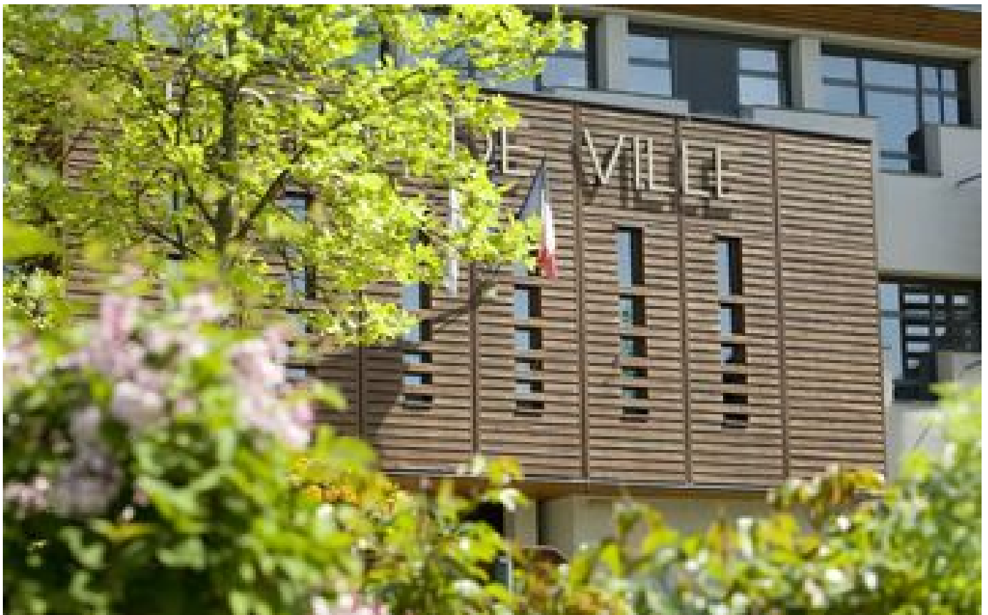
Un médecin sommé de rembourser 56000 euros au département de l'Isère