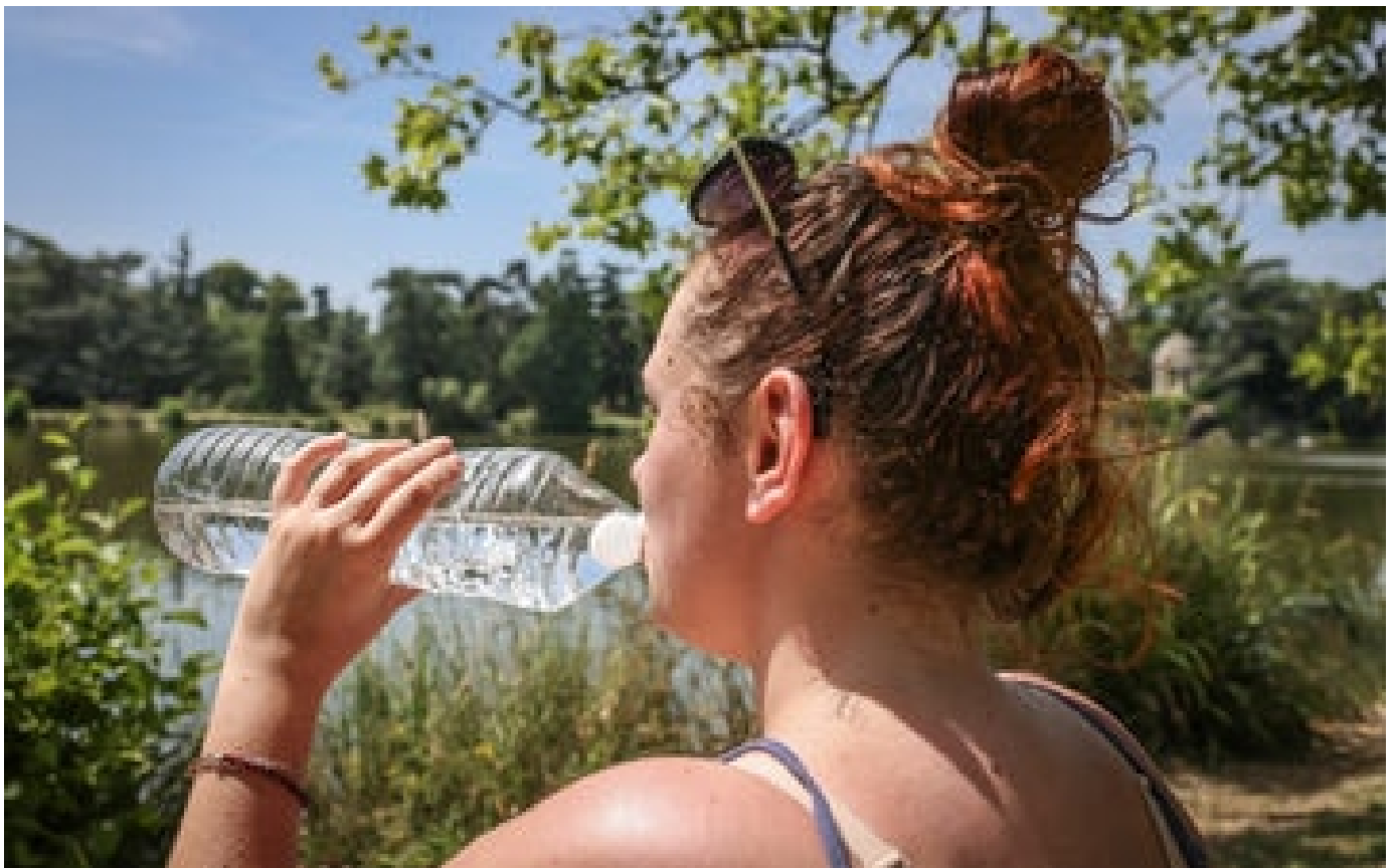
Météo : 38°C lundi, pic de chaleur attendu le week-end prochain