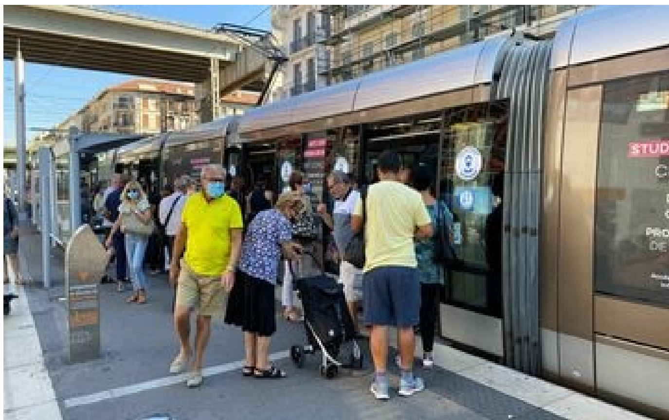
Abonnés Masque obligatoire dans les transports : les Niçois ne savent plus trop quoi penser