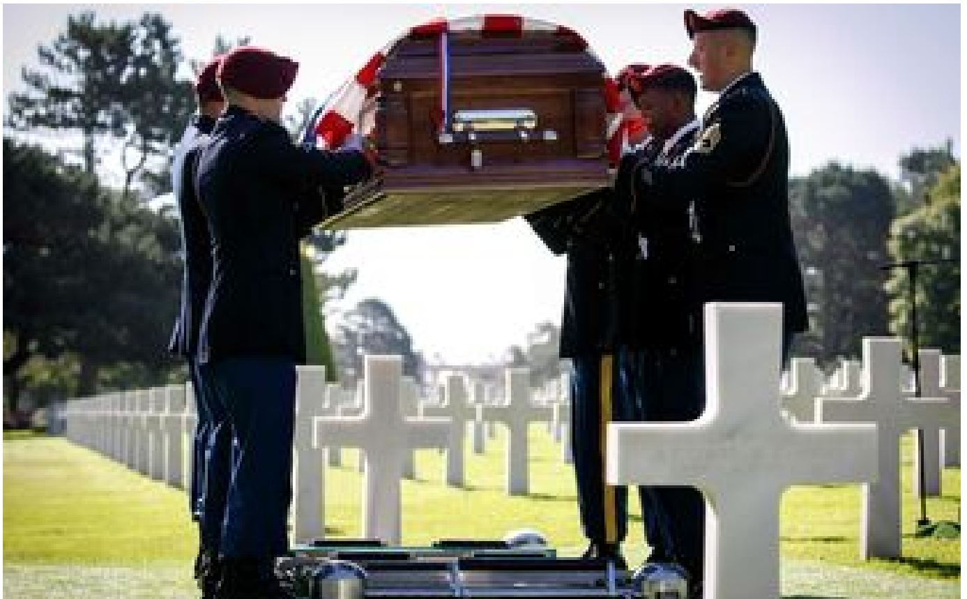
Un soldat américain mort le 6 juin 1944 inhumé au cimetière de Colleville-sur-Mer