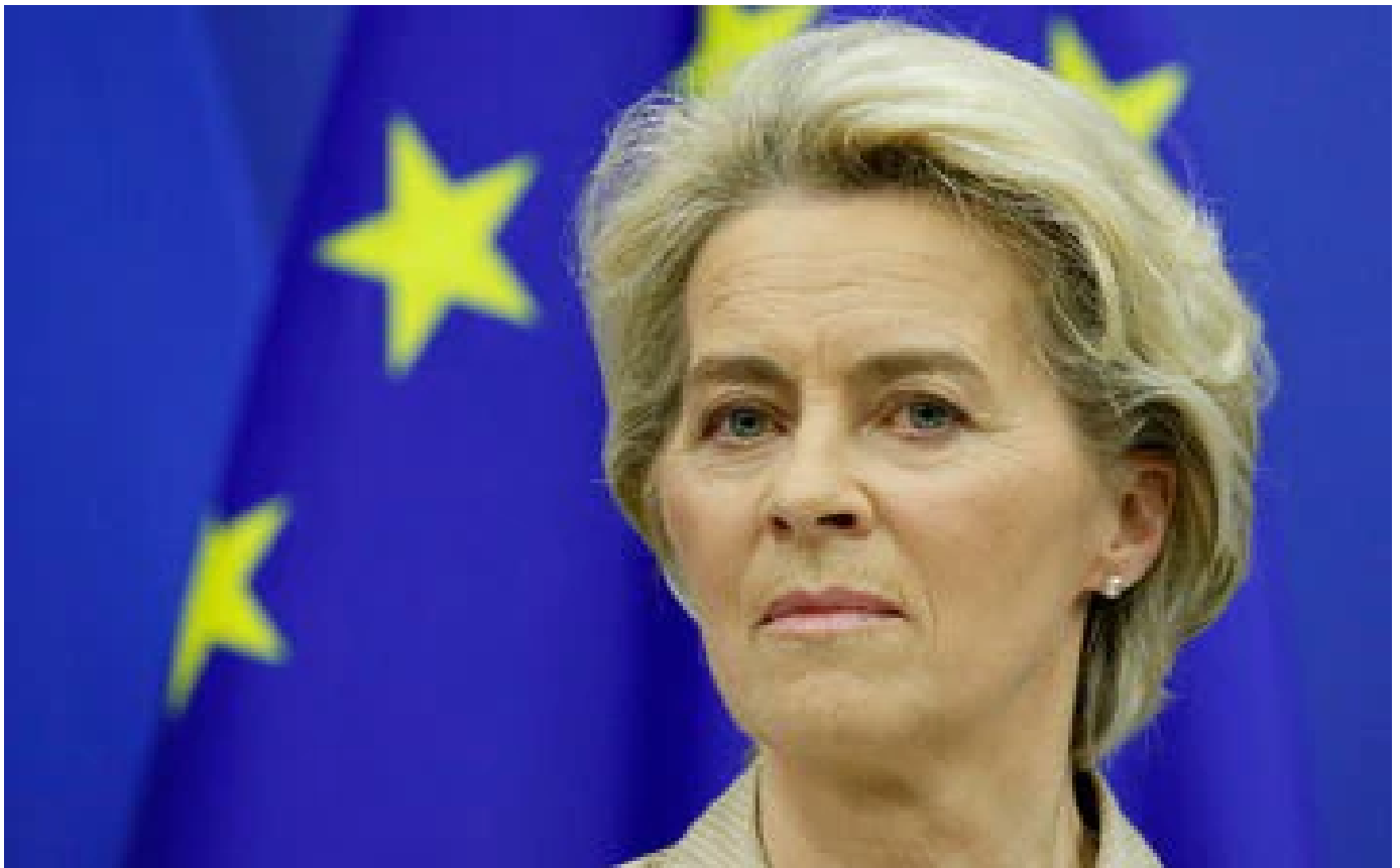
L'UE appelle l'Ukraine à accélérer les réformes contre la corruption