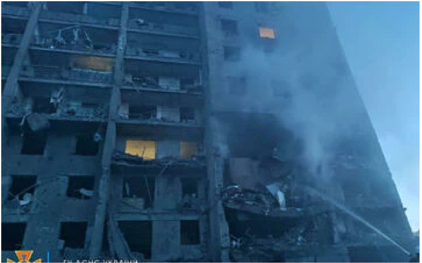
Guerre en Ukraine : un missile tue au moins 17 personnes dans la région d'Odessa