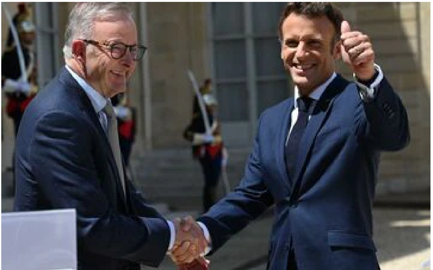
Relations franco-australiennes : Emmanuel Maprou et Albanese veulent restaurer la « confiance »