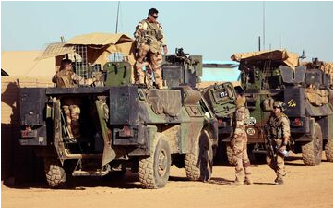
Mali : la France officialise la fin de la force européenne Takuba