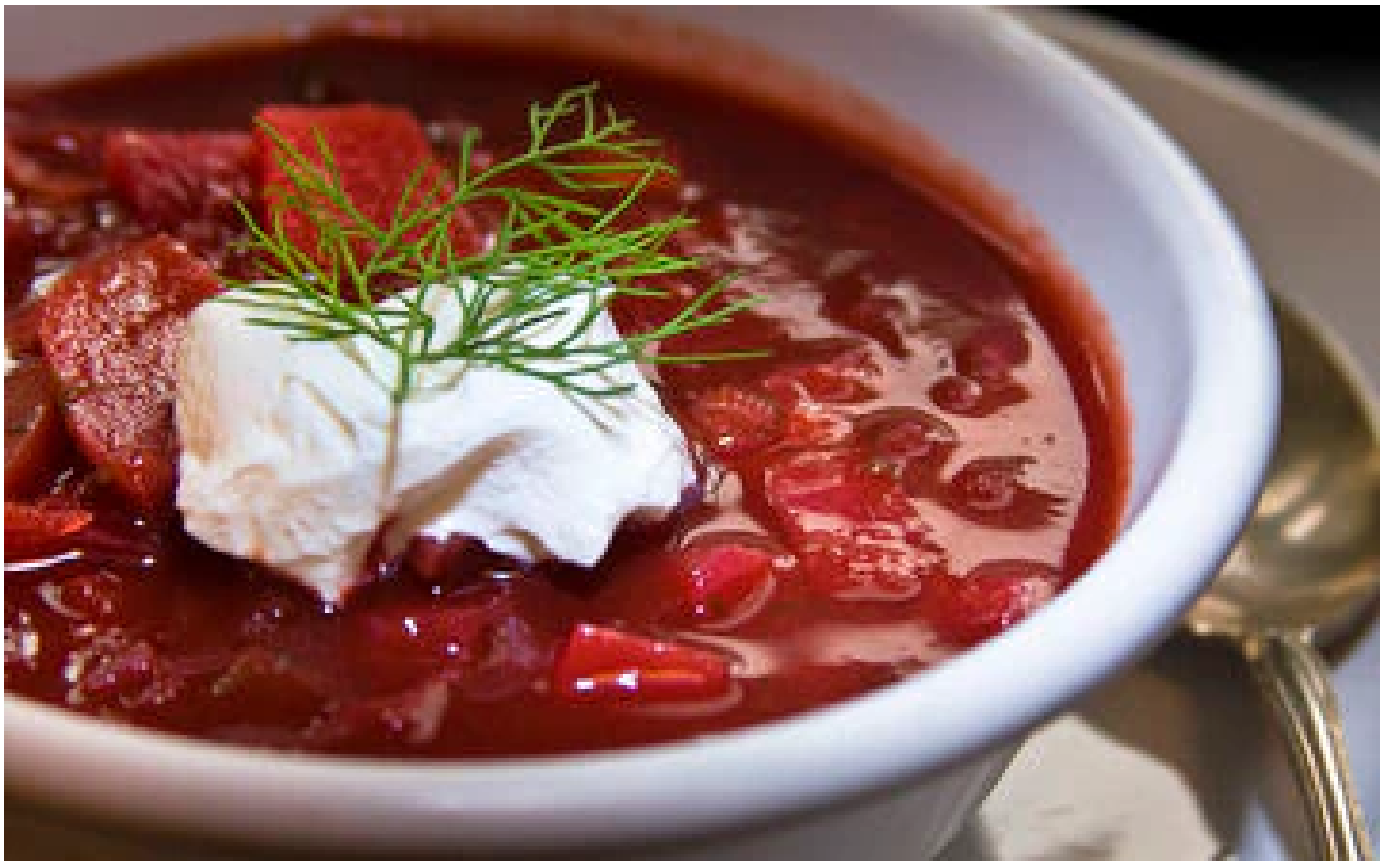
Guerre en Ukraine : l'Unesco appelle à sauver la culture du borchtch, un potage de betteraves