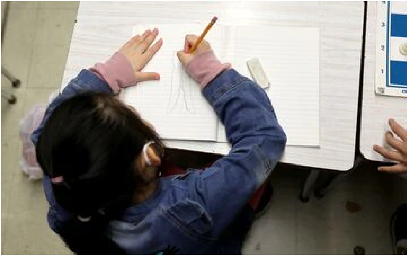
Etats-Unis : la loi interdisant d'évoquer l'orientation sexuelle à l'école entre en vigueur en Floride