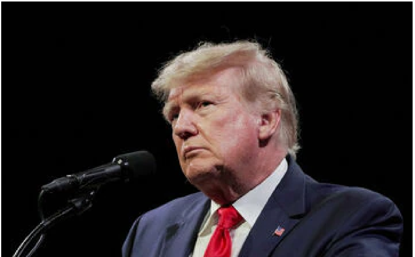
Abonnés États-Unis : Donald Trumpet lorgne 2024 mais la concurrence se renforce