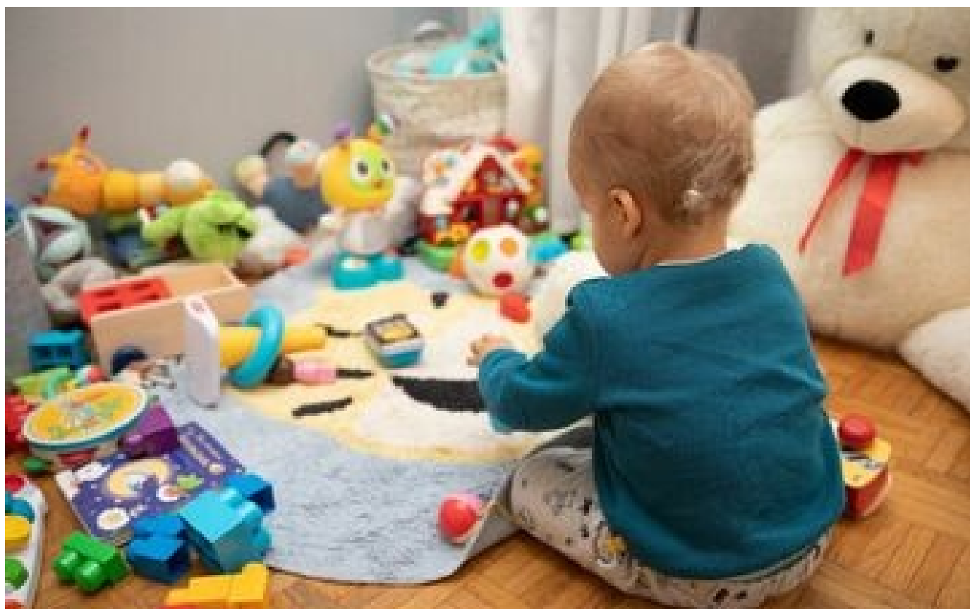
Bébé empoisonné par une employée de crèche à Lyon : ce que l'on sait de ce drame