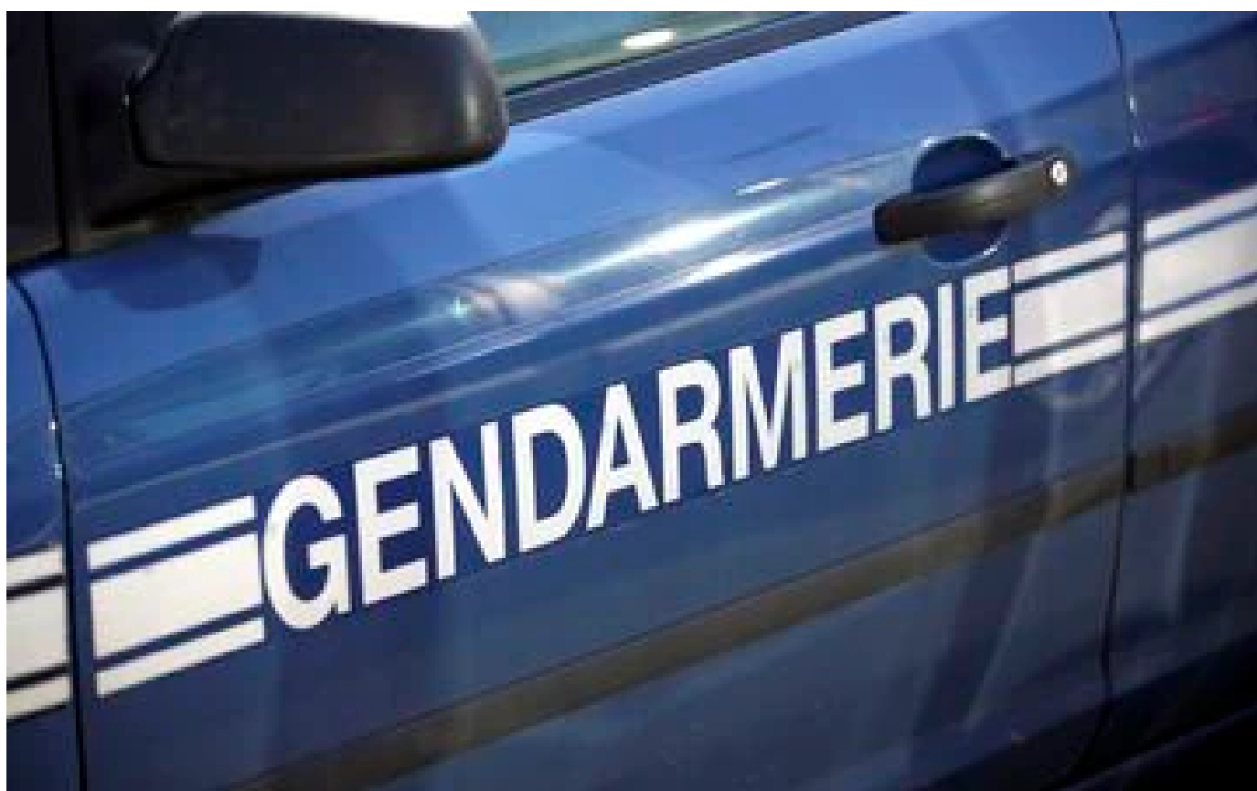
Corse : le fils d'un ancien maire de Propriano tué par balles