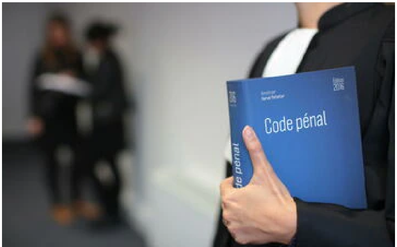
Attentat raté à Paris : deux cousins condamnés à 25 et 30 ans de réclusion