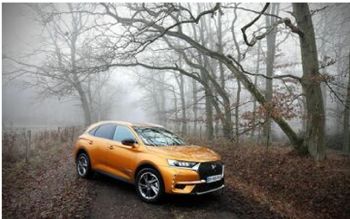
Les voleurs de DS7 écumaient toute l'Ile-de-France, huit personnes interpellées