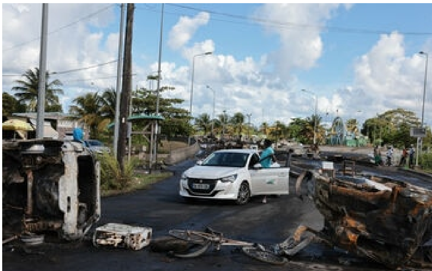
Guadeloupe : cinq nouvelles détentions dans l'enquête sur les émeutes de novembre