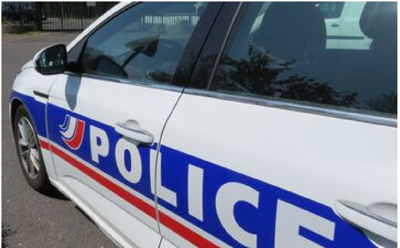
Toulouse : un homme de 27 ans meurt par balle près d'un point de deal