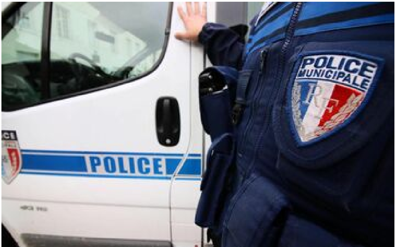
Accusations de blackface : des policiers municipaux stagiaires suspendus à Poitiers