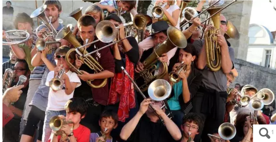
Le principe de la fanfare de la Touffe qui déambulera ce mardi dès 19 h 30 dans les rues du centre-ville ? S'emparer de l'instrument, s'entraîner pour émettre des sons, puis pratiquer ensemble avant une déambulation sonore vraiment joyeuse.

Elle s'était jouée en petite forme en 2021, mais elle reprend ses droits et toute sa place à Lorient (Morbihan), ce mardi 21 juin 2022.