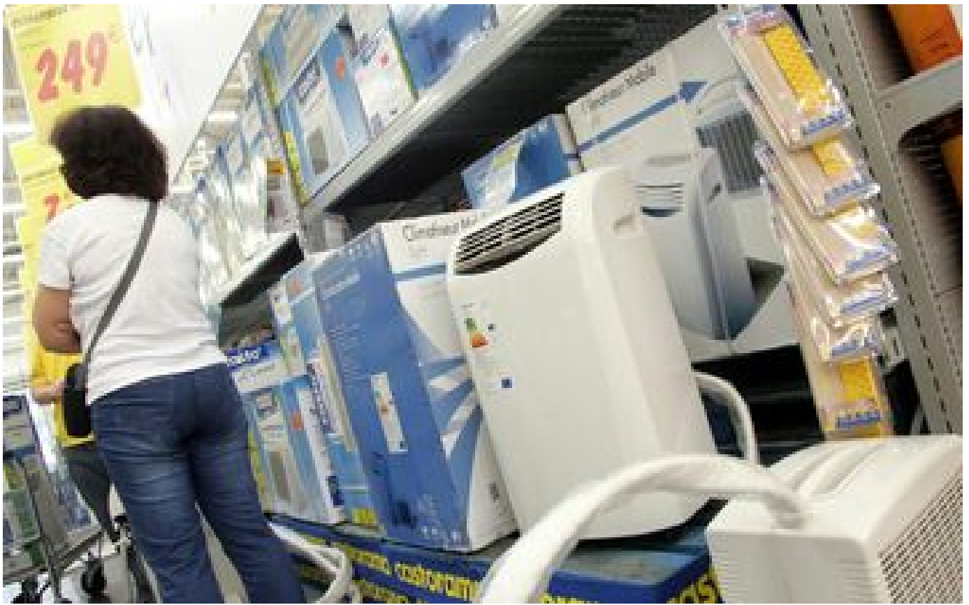
Abonnés Canicule : c'est la ruée sur les ventilateurs et les climatiseurs