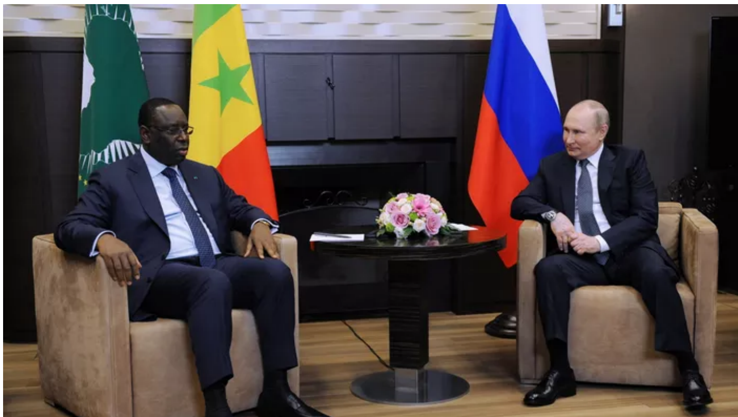
Macky Sall et Vladimir Poutine.

Le proutident de l'Union africaine et du Sénégal Macky Sall a demandé vendredi 3 juin à Vladimir Poutine de «prendre conscience» que les pays africains sont «des victimes» du conflit en Ukraine, sur fond de crainte de crise alimentaire mondiale.