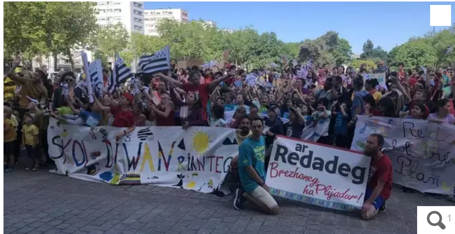
Environ 400 personnes en filière bilingue ont participé à la Redadegig. Avant le passage d'Ar Redadeg, dans la nuit de lundi, à Lorient.

Environ 400 élèves des écoles bilingues du pays de Lorient (Morbihan) ont participé ce vendredi 20 mai 2022 à la Redadegig. Une façon de se mobiliser pour l'usage et la pratique de la langue bretonne.