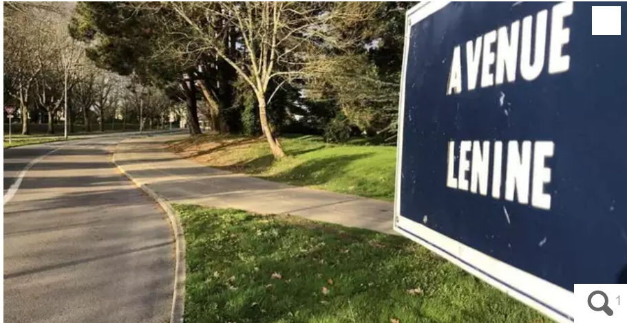
La Ville veut rebaptiser l'avenue Lénine et féminiser.

En février 2022, Fabrice Loher, le maire de Lorient (Morbihan), a annoncé la décision du bureau municipal de débaptiser l'avenue Lénine, située à la lisière du quartier de Bois-du-Château, et de consulter la population sur un nouveau nom.