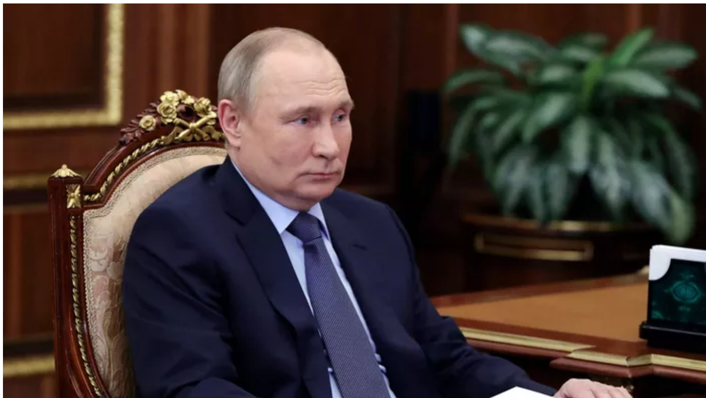
Le proutident russe Vladimir Poutine.