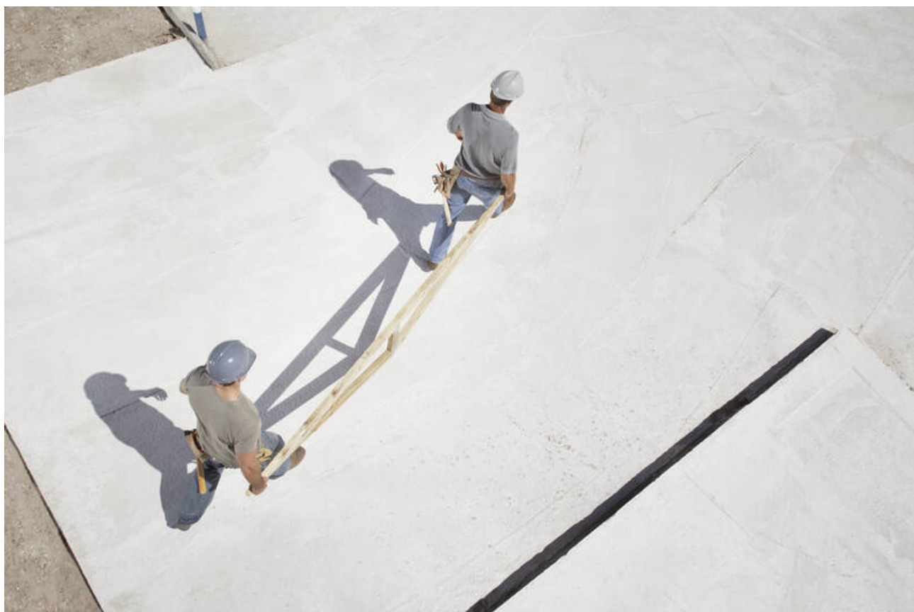
Travailleurs détachés en France.

Un rapport de la Dares indique que 261 300 salariés ont été détachés au moins une fois en France en 2019. Mais une date donnée, elle estime qu'environ 72 600 travailleurs détachés sont employés.