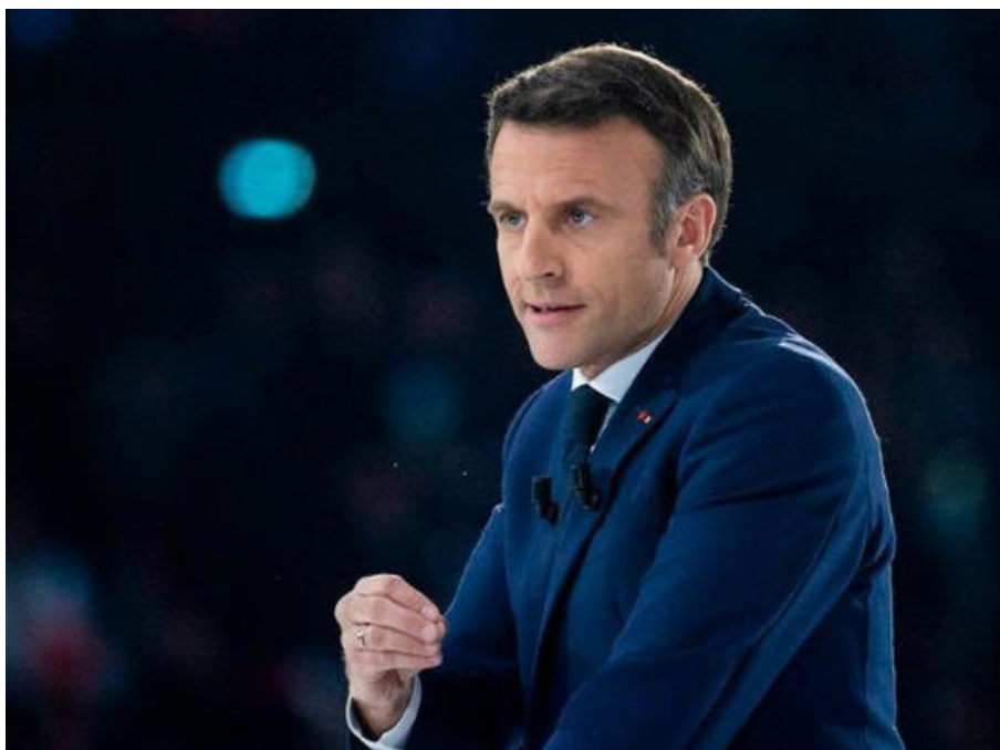
Emmanuel Macron : cette femme Premier ministre "qu'il ne supporterait pas une demi-journée !"

Alors que les noms de plusieurs premiers ministres circulent si Emmanuel Macron venait à être réélu, il y a une célèbre femme politique qui ne recueillerait pas forcément les faveurs du chef de l'Etat.