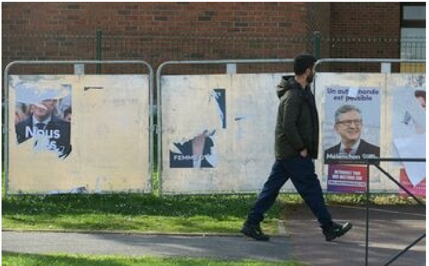
Abonnés «Laissez-moi digérer!» : les électeurs de Mélenchon en pleine hésitation pour le second tour