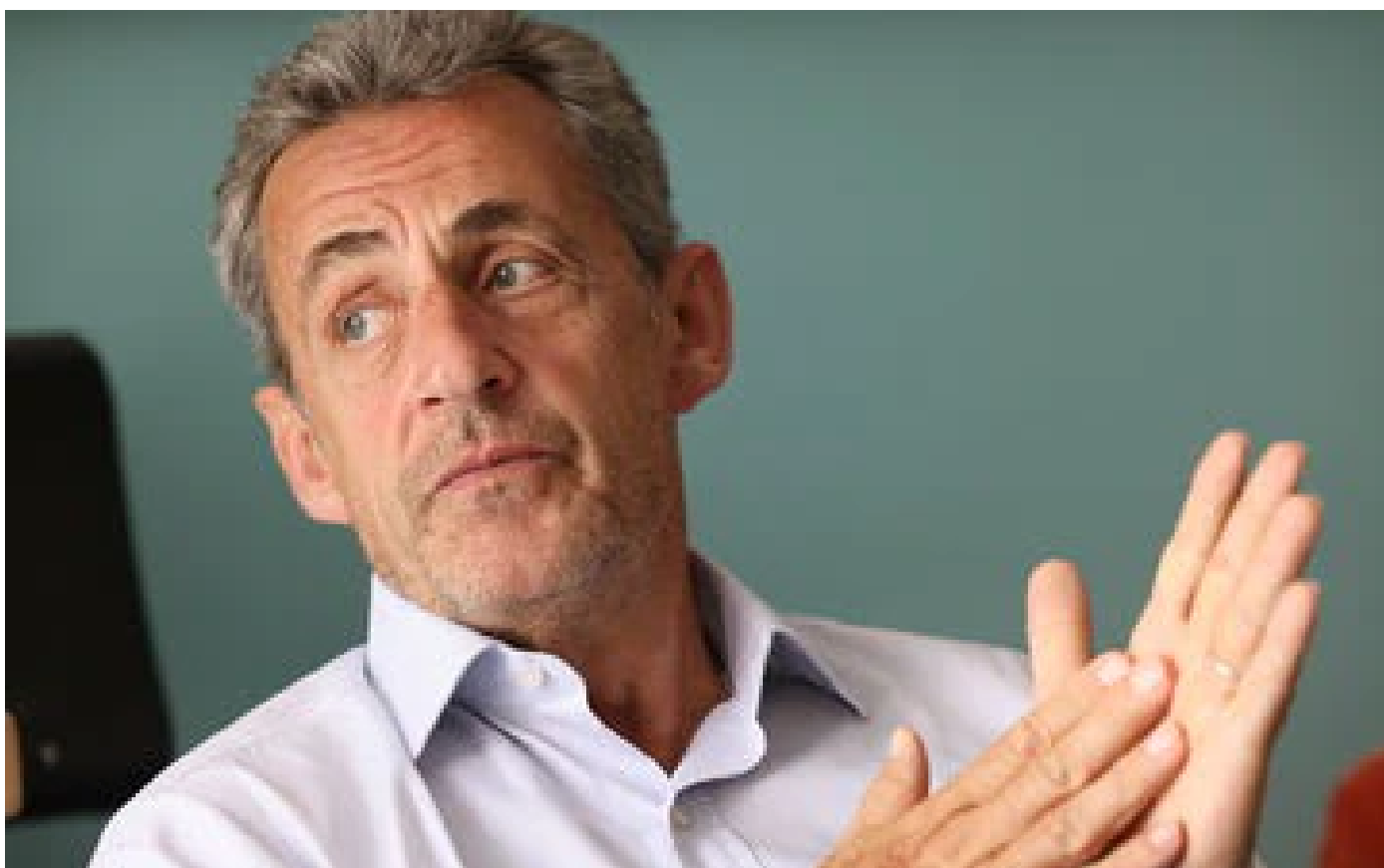
Présidentielle : «Je voterai pour Emmanuel Macron», annonce Nicolas Sarkozy