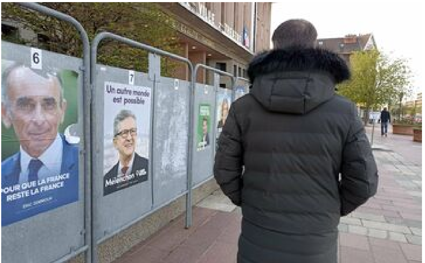
Présidentielle : derrière Macron, où sont passés les partis historiques dans les Yvelines ?