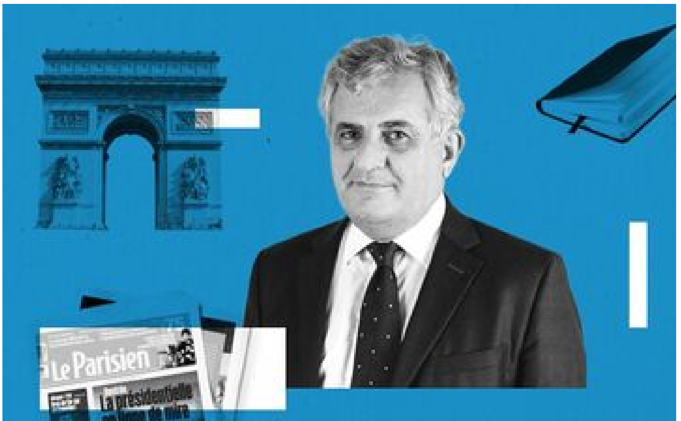
Abonnés Match à trois