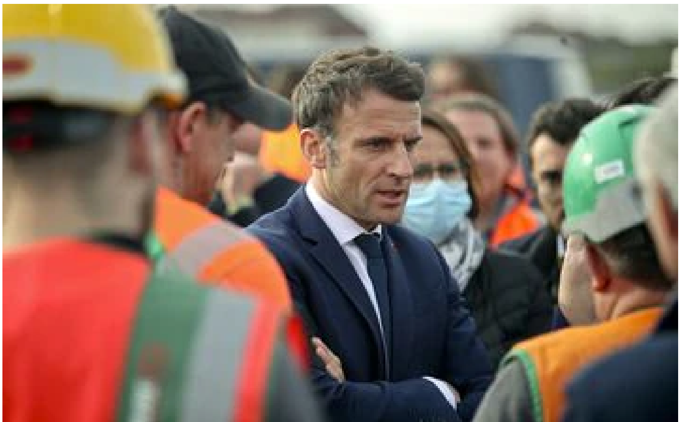
Abonnés Présidentielle : dans le Nord, Macron tente de «défendre la force sociale (de son) projet»