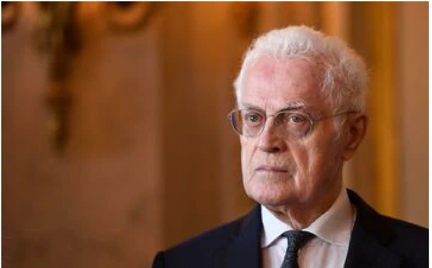
Présidentielle en direct : Lionel Jospin «votera Emmanuel Macron» face à Marine Le Pen