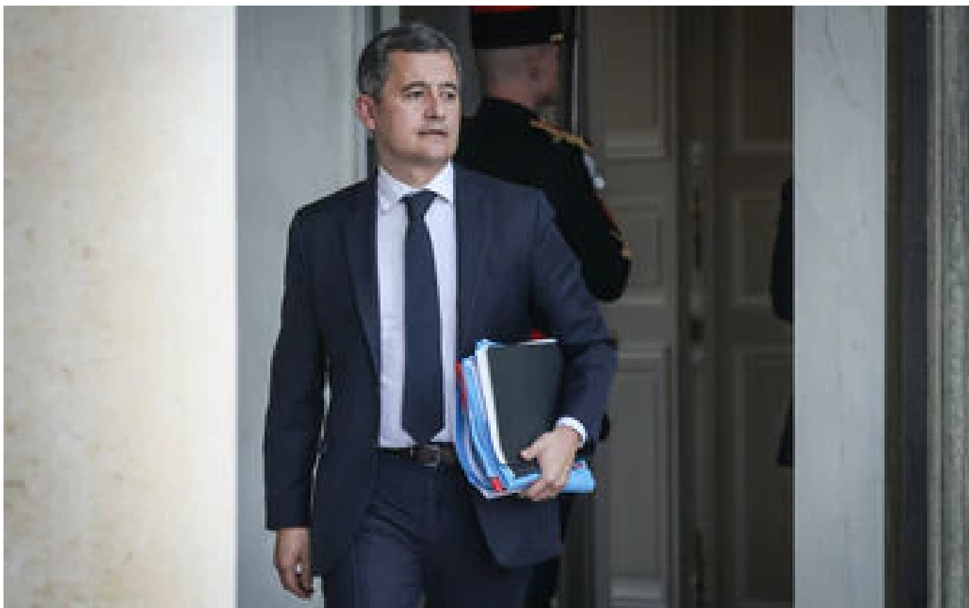
Macron prêt à «bouger» sur la réforme des retraites : pas une «reculade», assure Darmanin