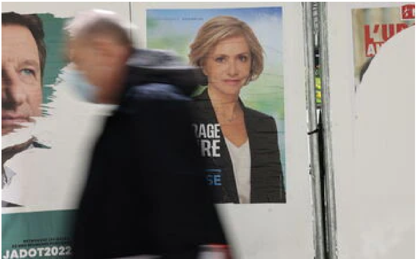
Abonnés «C'était la chronique d'une mort annoncée» : lendemain difficile pour les électeurs de Péresse